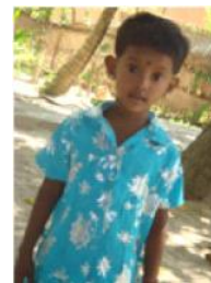
இவர் என் தங்கை