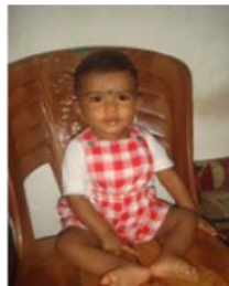
இவர் என் தம்பி