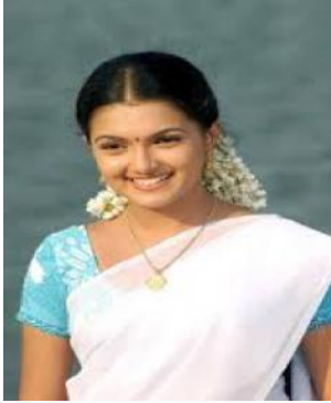
இவர் எனது அக்கா