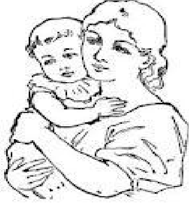
இவர் எனது அம்மா