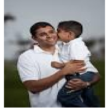
இவர் எனது அப்பா