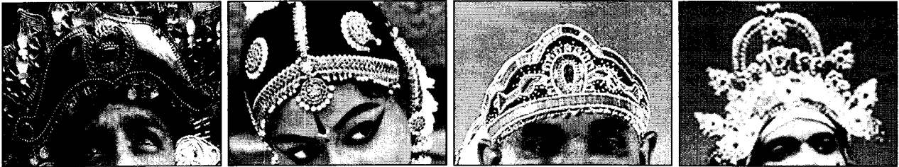
A B C D

● අංක 48 සිට 49 තෙක් ප්‍රශ්නවලට පහත දැක්වෙන රූප ඇසුරින් පිළිතුරු සපයන්න.