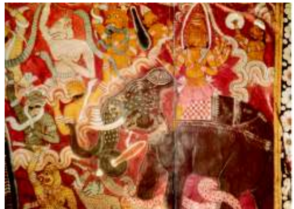
මාර පරාජය සිතුවමේ කොටසක්