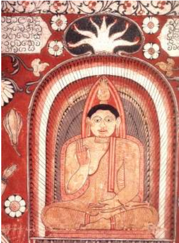
සුවිසි බුදුවරුන්ගේ නිර්මාණ අතර 'කෝණාගම බුද්ධ'