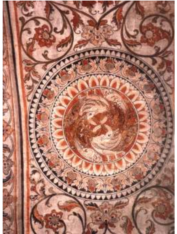
සිව් හංස පූර්ව