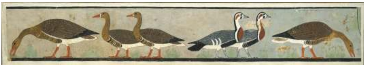
මීඩම් හි පාත්තයෝ (GEESE OF MEDIUM)