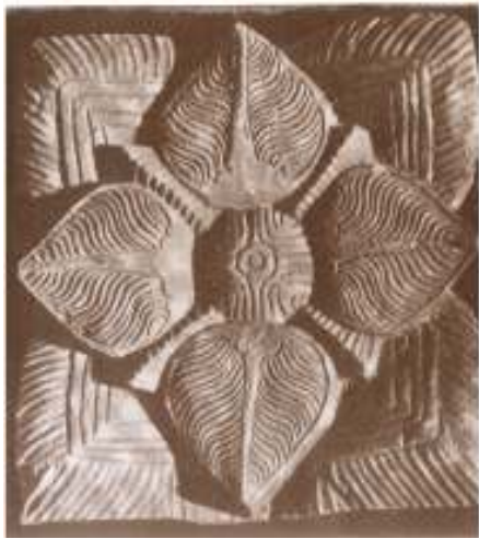
නෙළම - පේකඩ නිර්මාණයකි