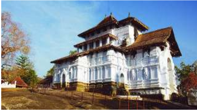
ලංකාතිලක රජ මහා විහාරය