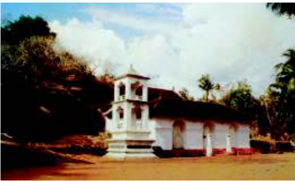
දෙගල්දොරුව රජ මහා විහාරය