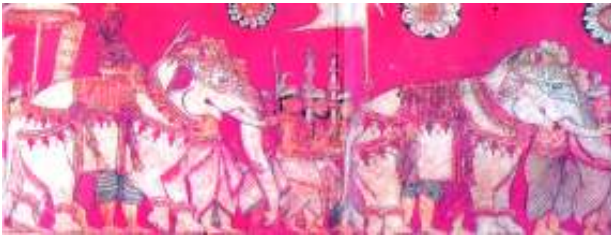
වෙස්සන්තර රජු අලි ඇතුන් දන් දීම