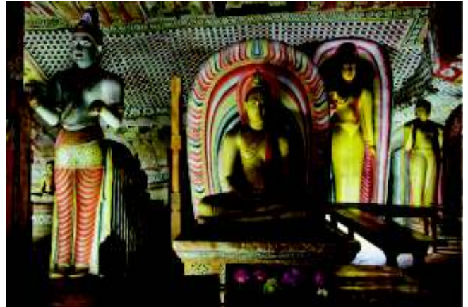
බුද්ධ ප්‍රතිමා හා දේව ප්‍රතිමාවක් (සුමන සමන් දෙවියන්)