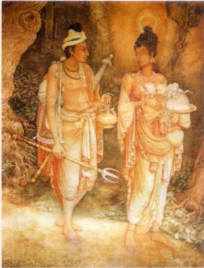
හේමමාලා කුමරිය හා දන්ත කුමරු ශ්‍රී දළදා වහන්සේ ලක්දිවට වැඩම කරවීම