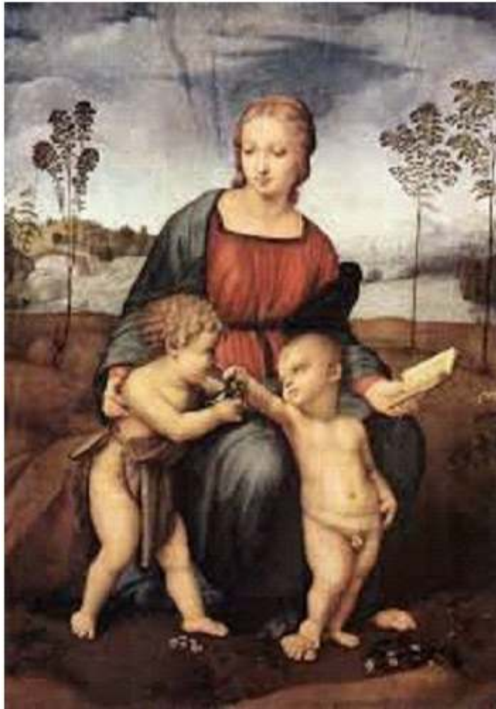
තණපිටියේ සිටින මැඩෝනා (Madonna of the Meadows)