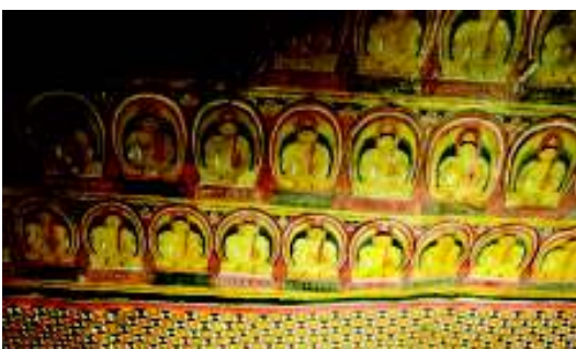
දහසක් බුදුවරුන්ගේ රූප