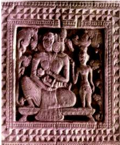
දරුවාට කිරි පොවන මව