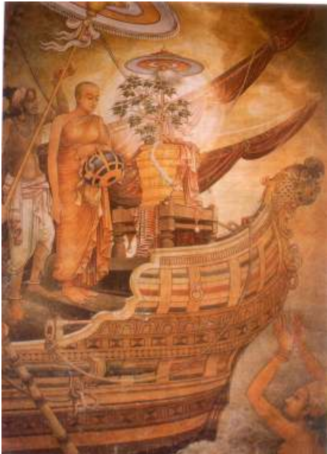
සංඝමිත්තා තෙරණීන් වහන්සේ ජය ශ්‍රී මහබෝධිය ශ්‍රී ලංකාවට වැඩම කරවීම