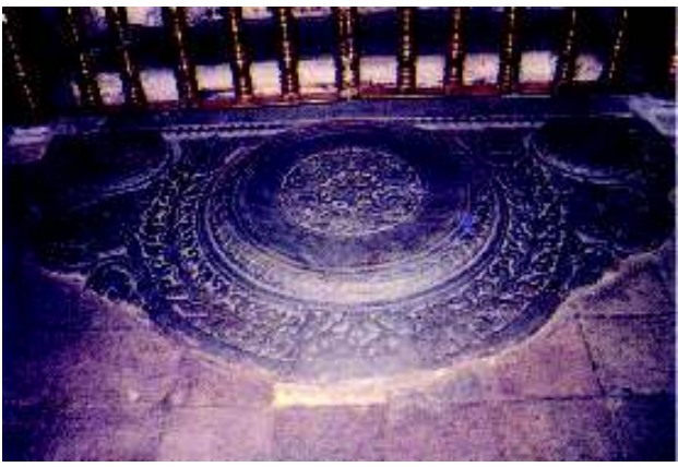
මහනුවර යුගයේ සඳකඩ පහණ