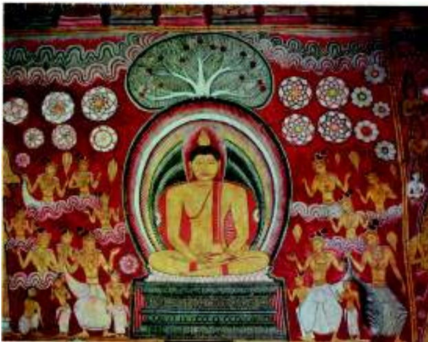
බුද්ධත්වයෙන් පස්වන සතිය-මාර දුවරු පරාජය කිරීම