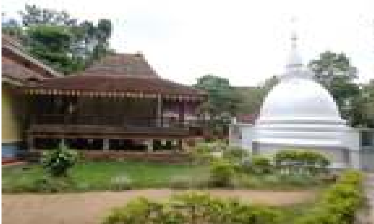
මැදවල ටැම්පිට විහාරය