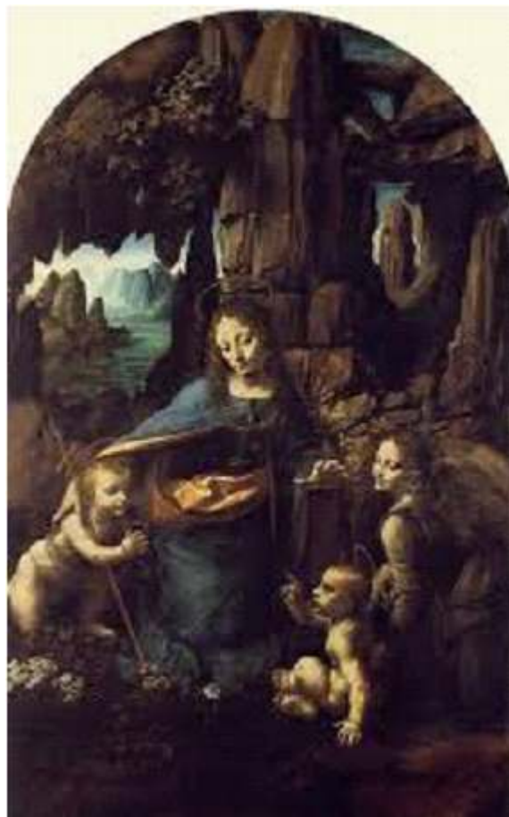
පර්වත මස්තකයේ දේවමෑණියෝ (Vergin of the rocks)