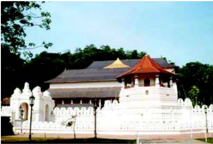
ශ්‍රී දළදා මාලිගය