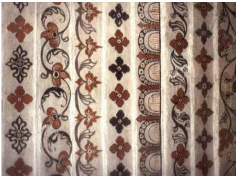
විවිධ සැරසිලි මෝස්තර