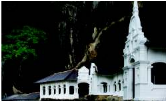
දඹුලු ලෙන් විහාර සංකීර්ණය