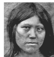
මොන්ගොලොයිඩ් (ල. 4)

ii. පහත සඳහන් වන්නේ ජලයේ බිහි වූ ජීවින් ගොඩබිමේදී විවිධ සතුන් ලෙස වර්ධනය වූ ආකාරයයි. එම සත්ව වර්ග අදාළ පිත්තූර වලට ගැලපෙන පරිදි යා කරන්න.