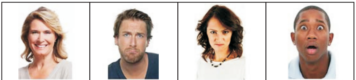
A B C D

04 (i) පහත රූප සටහනේ දැක්වෙන චිත්තචේත හඳුනාගෙන නම් කරන්න. (ල. 04)