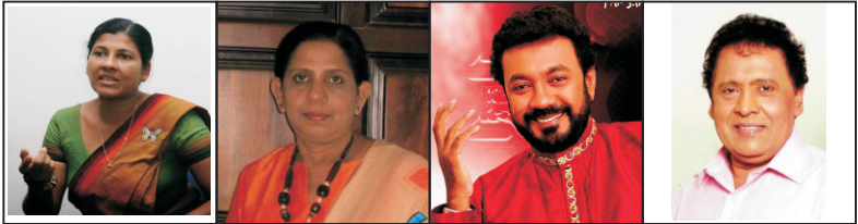
A B C D