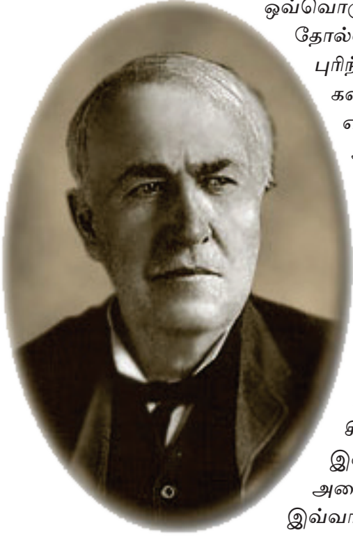
தாமஸ் ஆல்வா எடிசன்

சொல்வதே இல்லை. இதன் காரணமாக எதிர்காலத்தில் அவர்கள் தோல்வியை சந்திக்கும்போது மனமுடைந்து போகிறார்கள். தோல்விகளை எவ்வாறு எதிர்கொள்ளுவது என்பது அவர்களுக்குத் தெரியவில்லை. உடனே ஒரு விபரீதமான முடிவினை எடுக்கிறார்கள். அது தற்கொலை. தோல்விக்கு முடிவு தற்கொலைதான் என்று ஒவ்வொருவரும் தீர்மானித்திருந்தால் இந்த உலகம் இவ்வளவு வளர்ச்சி பெற்றிருக்குமா? இந்த உலகத்தில் ஒரு மனிதன் கூட மிஞ்சி இருக்க மாட்டான்.