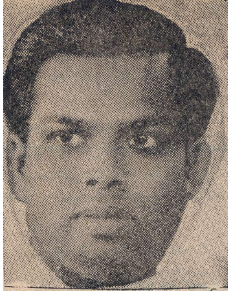
மஹாகவி து. உருத்திரமூர்த்தி