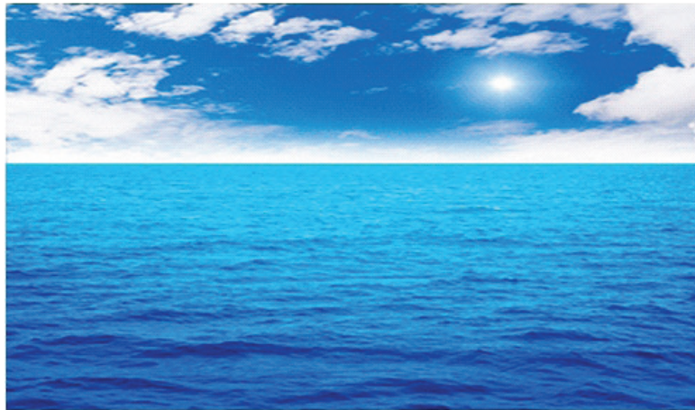
1.1 රූපය - දේව මැවිල්ල.

මම අහස දිහා හැමදාම බලාගෙන ඉන්නවා .මට දැන් තමයි තේරුණේ දෙවියන් වහන්සේ අහස මවා තිබෙන බව .