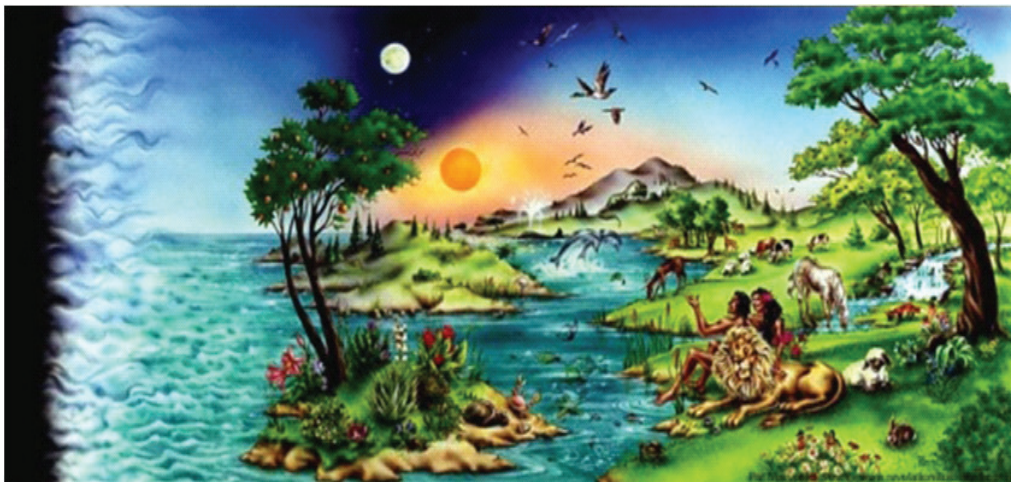
1.2 රූපය - දේව මැවිල්ල.

භාග්‍යා - දෙවියන් වහන්සේ තම ස්වභවය අනුව මිනිසා වැඩු සේක. දෙවියන් වහන්සේගේ ම ස්වභවය අනුව ඔවුන් වවා වදාළ සේක. පුරුෂයා ද ස්ත්‍රිය ද වශයෙන් ඔවුන් වැඩු සේක. උත්පත්ති 1:27 දෙවියන් වහන්සේ තමා වවා වදාළ සියලු දේ නඹා ඉතා වනභව ධව දුටු සේක. උත්පත්ති 1:31