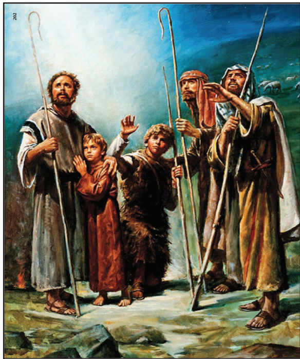
4.3 රූපය - එඬේරුන්

ජේසුස් වහන්සේගේ උපත දේව දූතයන් මුලින් ම දැනුම් දෙනු ලැබුවේ එඬේරුන්ට ය. එය විශේෂ කරුණක් වන්නේ ප්‍රථමයෙන් එම උපත පිළිබඳ ශුභාරංචිය එකළ සමාජයේ පිළිගැනීමට ලක් නොකළ දුප්පත් එඬේරුන්ට දැනුම් දුන් බැවිනි. පණිවුඩය ලද විගස ම ඔවුහු ඊට ප්‍රතිචාර දක්වමින් බෙන්ලෙහෙමට පැමිණ බිලිඳු ජේසුස් වහන්සේ බැහැදැක නමස්කාර කළ හ. මෙම සුවිශේෂී බිලිඳා ඔවුහු දුටු හ. ඉන් අපට මෙම උපතේ සුවිශේෂී භාවය වඩා දැකිය හැකි ය.