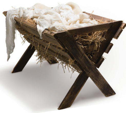
4.5 රූපය - ගව ඔරුව

මෙය ඉතා වැදගත් වන්නේ දේව පුත්‍රයා දිලීඳු දරුවකු ලෙස ඉපදීමත් බෙන්ලෙහෙමි නගරයේ නවාතැන් පලක් නොලැබී, ගව මඩුවක උපත ලබන්නට සිදුවීමත් ය.