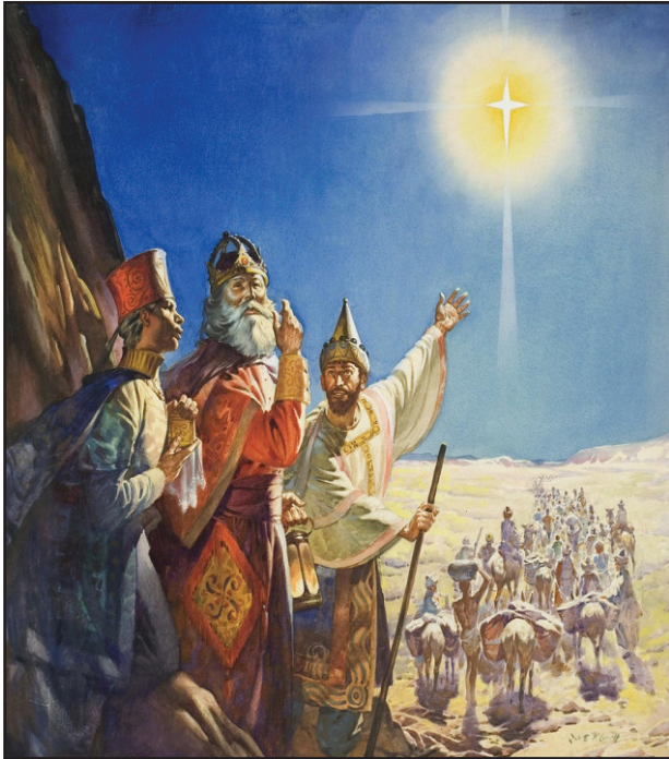
4.4 රූපය - ශාස්ත්‍රවන්තයින්ට මග පෙන්වූ විශේෂ තාරකාව

ජේසුස් වහන්සේගේ උපතේ සුවිශේෂී බව ශාස්ත්‍රවන්තයින් විසින් වටහා ගනු ලැබුවේ අහසේ පැවූ තාරකාව මගිනි.