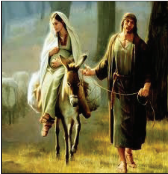
4.2 රූපය - මරියතුමිය හා ජෝසෙප්තුමා

ගාබ්‍රියෙල් දේව දූතයා දැනුම් දුන් ලෙස ජේසුස් වහන්සේගේ උපත සඳහා තමන් ව තෝරා ගත් බව ඇසූ කළ මරියතුමිය බිය වූවාය. කැළඹුණා ය. නමුත් එතුමිය දේව කැමැත්තට එකඟ වෙමින් නිහතමානී ව යටත් වූවා ය.