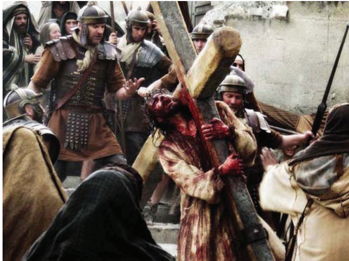
6.1 රූපය - ජේසුස් වහන්සේ කුරුසිය උසුලාගෙන යාම

එදා සිදු වූ දේ ලෝක ඉතිහාසය තුළ කිසි දිනක අමතක කළ නොහැකි ඉතා කණගාටුදායක සිදු වීමක්. අපි දැන් එය මතෙව්තුමාගේ ශුභාරංචියට අනුව පිළිවෙලින් අධ්‍යයනය කරමු.