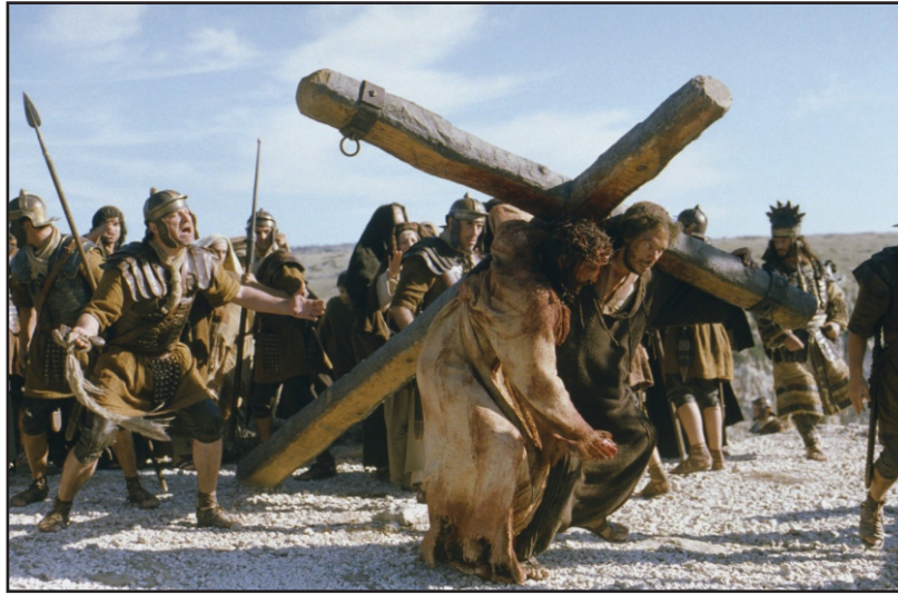
6.2 රූපය - ජේසුස් වහන්සේට කුරුසිය උසුලාගෙන යාමට කිරේනියේ සීමොන් උපකාර කිරීම

ජේසුස් වහන්සේගේ කුරුසිය උසුලාගෙන යාමට කිරේනියේ සීමොන් නම් පුද්ගලයාට බලකරනු ලැබූ අතර ඔහු ජේසුස් වහන්සේගේ කුරුසිය උසුලාගෙන යාමට උපකාරී විය.