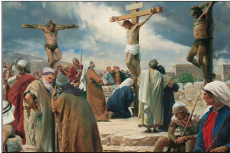
6.1 රූපය - ජේසුස් වහන්සේ කුරුසිය මත දිවි පිදීම

උන්වහන්සේට දෙපසින් සොරුන් දෙදෙනකු ඇණ ගැසූ අතර එක් සොරකු එතුමාණන්ට නින්දා කළ හ. නායක පූජකයන්, ප්‍රජා මූලිකයන් හා විනයධරයන් ද කුරුසිය පාමුල සිට උන් වහන්සේට කවටකම් කළ හ.