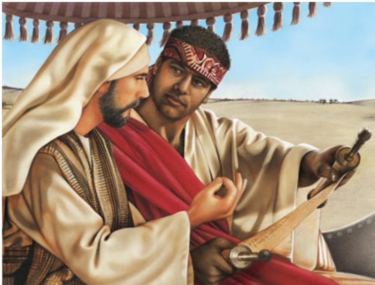
12:1 රූපය - ගාසාවට යන මාර්ගයේ පිලිප්පුමා හා එනියෝපිය ජාතික මිනිසා

මේ වචන ඇසුණු විට, ඔහු හා කථා කරන්නට ශුද්ධාත්මයාණන් වහන්සේ මට මග පෙන්වුවා. මා රථය ප්‍රභව ම දුව ගොස් ඔහු කියවන දේ තේරෙනවා දැයි ඇසුවා. ඔහුගේ පිලිතුර වුණේ “යමෙක් වග පෙන්වුවොත් වස වට තෝරවී ගත හැක්කේ කෙසේ ද ” යන්න යි.