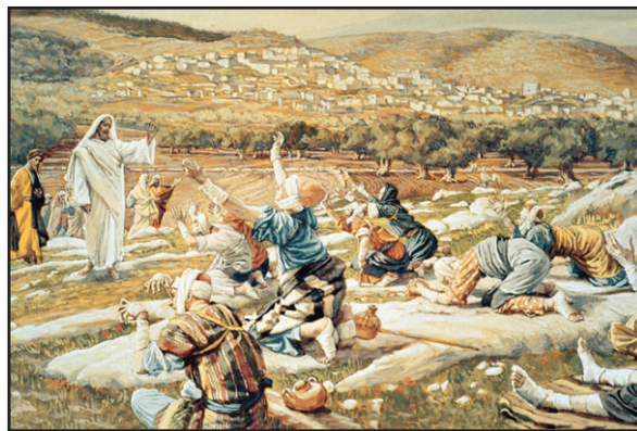
16.1 රූපය - ජේසුස් වහන්සේ ලාදුරු රෝගීන් සුව කිරීම

සීයා: පුතේ, අසරණ රෝගීන්ට, මේ වගේ සමාජයෙන් කොන්වුණු අයට පිහිට වෙන එක ජේසුස් වහන්සේගේ සේවයේ කොටසක්. ඒ නිසා උන්වහන්සේ ඔවුන් ව පිළිගෙන ඔවුන්ට සවන් දුන්නා. කණ්ඩායමක් ලෙස ඇවිත් මේ ලාදුරු රෝගීන් දස දෙනා දුරින් සිට ජේසුස් වහන්සේට කිව්වා “ජේසුස් වහන්ස, ආචාරිණී, අපට කරුණා කරන්න” කියා. හරිම පුදුමයි උන්වහන්සේ කිසිම දෙයක් කළේ නැහැ ඔවුන් දස දෙනාට කිව්වා “ගිහින් ඔබේ පූජකවරුන් ඉදිරියේ පෙනී සිටින්න කියා.