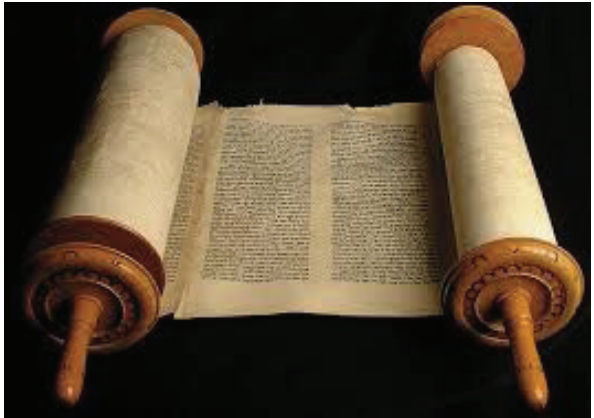
18 රූපය - ස්ක්‍රෝල් පත්

බයිබලය යන වචනය බිදී ආවේ 'බිබ්ලියොන්' යන ග්‍රීක වචනයෙනි. එහි අර්ථය පොත් ගණනාවක එකතුවක් යන්නයි. පොත් ගණනාවක් ඇතුළත් ශුද්ධ බයිබලය පුස්තකාලයක් ලෙස ද අපට පිළිගත හැකි ය.