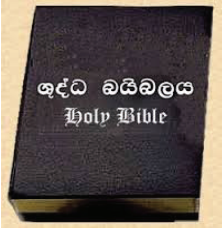
18:1 රූපය - ශුද්ධ බයිබලය

ශුද්ධ බයිබලය කිතුනු අපගේ පූජනීය ග්‍රන්ථය යි. විත්‍රයේ දැක්වෙන ලෙස ශුද්ධ බයිබලය අතීතයේ දී එකම ග්‍රන්ථයක් සේ සකස් වී නොතිබුණි. වර්තමානයේ ශුද්ධ බයිබලයේ පිටපත් ගණනාවක් අප අතට පත් වී ඇත. දෙවියන් වහන්සේ තෝරාගත් ඉග්‍රායෙල් ජනතාවගේ ඉතිහාසය ඔවුන්ගේ ජීවිත ගමන තුළ ලත් අත්දැකීම් හා සම්බන්ධ තොරතුරු රාශියක් පළමුව ආරක්ෂා වූයේ ඔවුන්ගේ ජන කොටස තුළ වාචිකව ය.