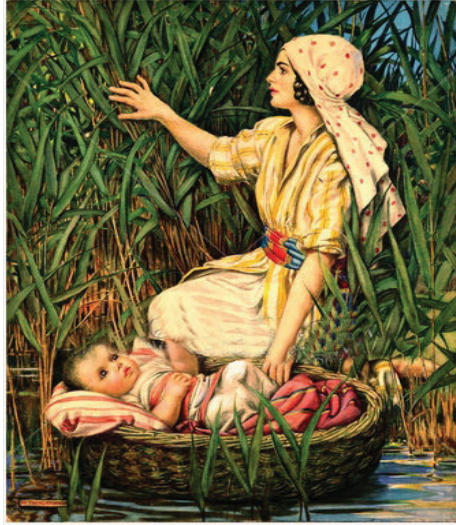
21:2 රූපය - මීරියම් මල්ලි ව සඟවා රැක බලා ගනිමින්

සහෝදර ප්‍රේමය නිසා මීරියම් දෙවරයෙන් මල්ලි ව සුරැකීමට ඉදිරිපත් වීම.