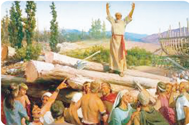
1.1 රූපය - දිවැසිවර කැඳවීම

කන්නාඩියක් සුර්ය ආලෝකයට අල්ලා අවශ්‍ය තැනට එම ආලෝකය පරාවර්තනය කිරීමේ හැකියාව ඇත. ඒ අනුව, කන්නාඩියෙන් පරාවර්තනය කරන්නේ කන්නාඩියට පතිත වන ආලෝක කිරණ වේ. කන්නාඩියක් කරන කාර්යය කළ පුද්ගල කණ්ඩායමක් පුරාණ ගිවිසුම තුළ ඇත. ඒ අය නම් “ඉශ්‍රායෙල් දිවැසිවරුන්” ය. දෙවියන් වහන්සේගේ පණිවුඩය ඔවුන් කරා පැමිණි විට ඔවුහු එය ඉශ්‍රායෙල් ජනතාවට ප්‍රකාශ කළහ. පහත පින්තූරයෙන් එය පිළිඹිබු කෙරේ.