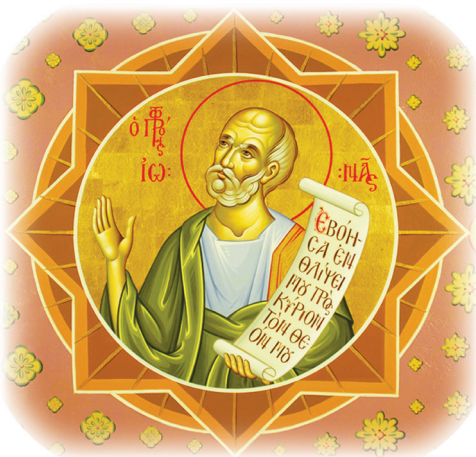
4.4 රූපය - ජෝනා දිවැසිවරයා

ජෝනා දිවැසිවරයා ක්‍රි.පූ. 5 වන සියවසේ ජීවත් වූ දිවැසිවරයෙක් ලෙස පිළිගැනේ . ඉග්‍රායෙල්හි විරුද්ධවාදීන් ජීවත් වූ නිතිවයට ගොස් එහි වැසියන් මනස්තාපනයට කැඳවීම ජෝනා දිවැසිවරයා ලත් කැඳවීම ය. දෙවියන් වහන්සේගේ කැඳවීම ප්‍රතික්ෂේප කළ ජෝනා දිවැසිවරයා කාර්ෂ්‍ය නුවර කරා යන්නට නැව් නැග්ගේ ය. එතුමන් සිටි නැව කුණාටුවකට හසුවිය. එසේ වූයේ කවුරුත් නිසාදැයි බැලීමට නැවේ සිටි