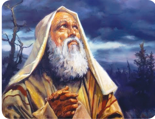
5.1 රූපය - ආබ්‍රහම් තුමා

ආදම් හා ඒව පව් කළ පසු ගැලවුම්කරුවකු එවා මනුෂ්‍ය සංහතිය පාපයෙන් ගලවා ගැනීමට දෙවියන් වහන්සේ පොරොන්දු වූ සේක. එම පොරොන්දුව ඉටු කිරීමට දෙවියන් වහන්සේ තෝරාගත් පළමු තැනැත්තා වන්නේ, ආබ්‍රහම් තුමා ය. එතුමා ආදි ජිනාවරයකු ලෙස හැඳින්වේ. එලෙස දෙවියන් වහන්සේ ආබ්‍රහම් තුමා තෝරා ගනු ලැබීම එතුමාට දුන් විශේෂ කැඳවීමෙන් ආරම්භ වේ. එම කැඳවීම ශුද්ධ බයිබලය මෙසේ වාර්තා කරයි.