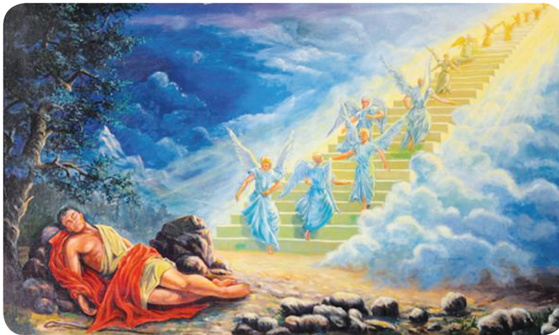
8.2 රූපය - බෙතෙල්හි දර්ශනය