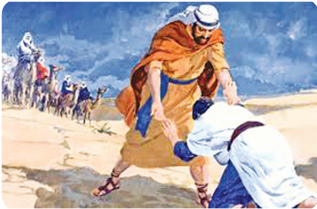
8.4 රූපය - ජාකොබ් ඒසව්ට වැදීම