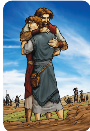
8.5 රූපය - ඒසව් සමග සමගිවීම

ජාකොබ් තෙත් ඔසවා බැලූ විට, පුදුමයකි, ඒසව් ද ඔහු සමඟ හාරසියයක පිරිසක් ද එනු දිටී ය. ජාකොබ් තම සොහොයුරා වෙත පැමිණෙන තෙක් සත් වරක් බිමට නැමී වැන්දේ ය.