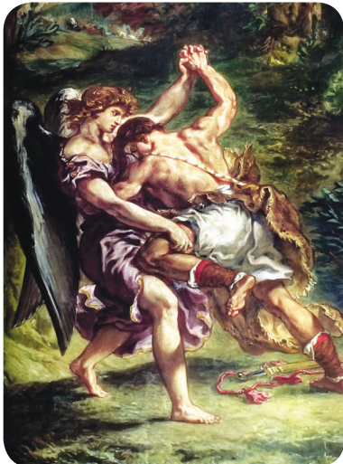
8.3 රූපය - පෙනුයෙල්හි දර්ශනය

ජාකොබ් තුමා භාරාන්හි ජීවත් වී ආපසු පොරොන්දු දේශයට පැමිණෙමින් සිටියේ ය. එක්තරා මිනිසෙක් එක් රාත්‍රියක පහන් වන තුරු ම ඔහු සමග පොර බැදුවේ ය. ඒ තැනැත්තාට එතුමාගෙන් ජය නොලැබෙන බව දුටු විට, ඔහු එතුමාගේ කලවා සන්ධියට පහරක් ගැසී ය. එවිට ජාකොබ් තුමාගේ කලවා සන්ධිය විසන්ධි විය. පහන් වේගෙන එන බැවින් ඔහුට යන්නට ඉඩ හරින්න යැයි ඒ තැනැත්තා ජාකොබ් තුමාට කී විට, “ඔබ මට ආශීර්වාද