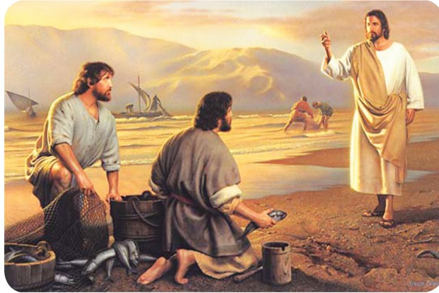
9.1 රූපය - ප්‍රථම ශ්‍රාවකයන් හතර දෙනා කැඳවීම

ජේසුස් ස්වාමීන් වහන්සේ අනුව ගිය ප්‍රථම ශ්‍රාවකයෝ (මතෙව් 4:18-22)