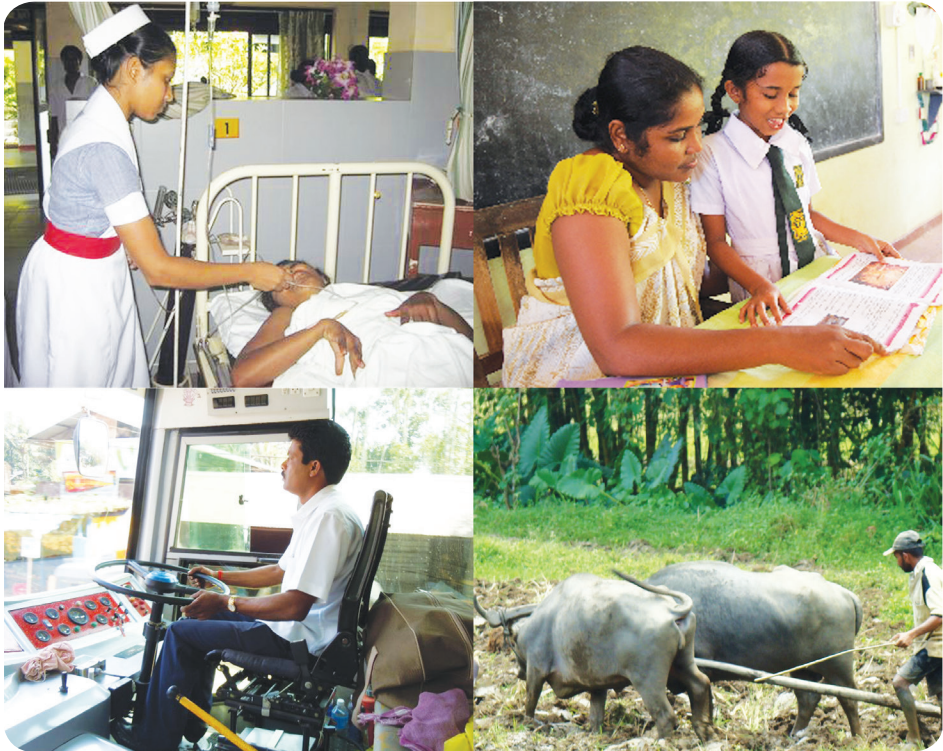
13.1 රූපය - අපට උදව්වන අය

මෙම පින්තූරවල සිටින්නන් පොදු ජනතාවට සේවය කිරීමට තම තමන්ගේ හැකියා අනුව වෘත්තීන් තෝරා ගත් අය ය. ඒ අය එම සේවාවන් කරන්නේ රැකියාවක් වශයෙනි. එහෙත් අප කිතුනුවත් වශයෙන් කැපවීමෙන් අන් අයගේ යහපත සඳහා සේවය කිරීමට කැඳවනු ලබයි. එලෙස කැඳවනු ලබන්නේ ප්‍රසාද ස්නාපයෙනි.