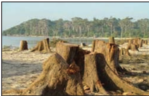
ගස් කපා වනාන්තර එළි පෙහෙලි කිරීම

මිනිසා විසින් දේව මැවිල්ල විනාශ කරන අවස්ථා මොනවා ද?