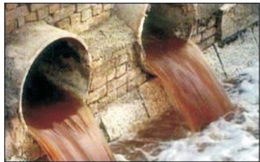
අපවිත්‍ර ජලය පිරිසිදු ගංගාවලට මුදා හැරීම