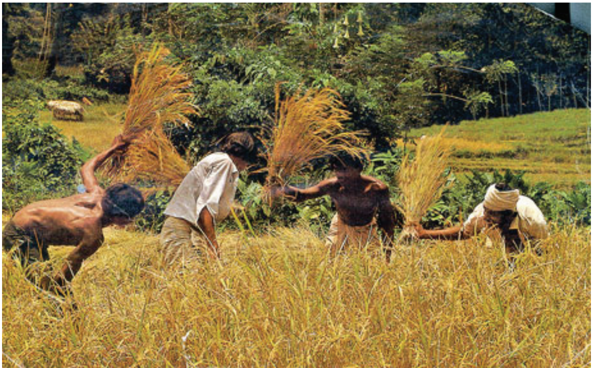
රූපය 1.6 සාමූහික ව ගොයම් කැපීම