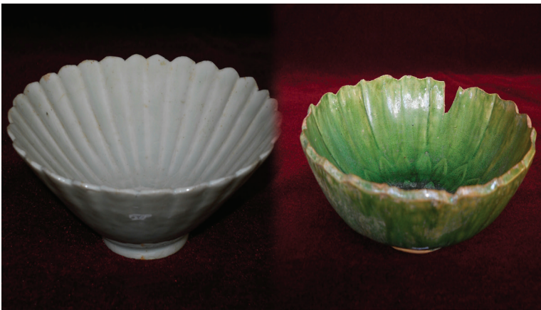
රූපය 1.14 ශ්‍රී ලංකාවෙන් හමු වූ චීන මැටි බදුන්

පිටරටින් ගෙන්වන භාණ්ඩ (ආනයනය කරන ලද) සහ පිටරට යවන භාණ්ඩ (අපනයනය කරන ලද) ගොඩබෑම සහ පැටවීම සිදු කළේ මෙබඳු වරායන් මගිනි.