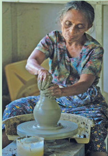
රූපය 1.12 සකපෝරුව භාවිත කරමින් මැටි භාණ්ඩ තැනීම