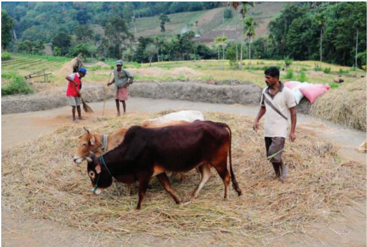
රූපය 1.9 සතුන් යොදා ගෙන ගොයම් මැඩීම