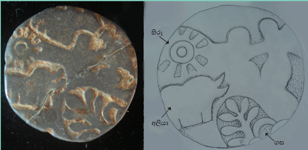
රූපය 1.13 අම්පාර රජගල පුරාවිද්‍යා භූමියෙන් ලැබුණු හස්ඵබු කහාපණ කාසියක් (වම්පස කාසිය ද දකුණුපස අනුරුවක් ද දක්වේ)

වෙළෙඳාම දියුණු වීමත් සමඟ වෙළෙඳ නගර බිහි විය. අනුරාධපුරය, මාගම එවැනි වෙළෙඳ නගර දෙකකි. ඇතැම්විට මෙබඳු වෙළෙඳ නගර මූලාශ්‍රයවල නිගම යනුවෙන් හඳුන්වා ඇත. වෙළෙඳාමෙන් ධනවත් වූ අය මෙම නගරවල ජීවත් වූහ. මේ පිරිස් අතර දේශීය මෙන් ම විදේශීය ජනයා ද සිටි බව පෙනේ. වෙළෙඳාමට සම්බන්ධ අය වෙත ම කණ්ඩායමක් ලෙස සංවිධානය වූහ. එවැනි වෙළෙඳ සංවිධාන “පුග” යනුවෙන් හඳුන්වා ඇත. විදේශීය වෙළෙඳන්දන් සංවිධානය වී සිටි වෙළෙඳ ශ්‍රේණි කිහිපයක් විය. නානාදේසි සහ වලඤ්ජියාර් එම වෙළෙඳ ශ්‍රේණිවලට උදාහරණ වේ. මේ එක් එක් වෙළෙඳ ශ්‍රේණි තම අන්‍යතාව තහවුරු කිරීම සඳහා සංකේත භාවිත කර ඇත. ඒවා මුද්‍රා ලෙස හැඳින්වේ.