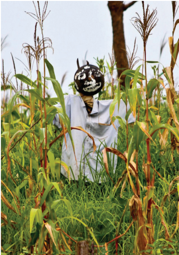
රූපය 1.3 පඹයා