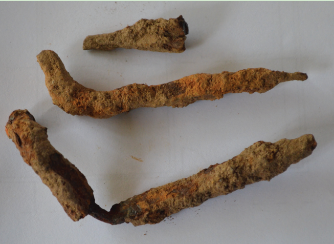
රූපය 1.11 වම්පසින් යකඩ කර්මාන්තය සඳහා භාවිතා කරනු ලබන මයිනහම දකුණු පසින් පුරාවිද්‍යා කැණීම්වලින් හමු වූ පැරණි යකඩ ඇණ කිහිපයක්