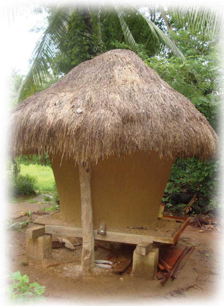
රූපය 1.7 වි බිස්ස