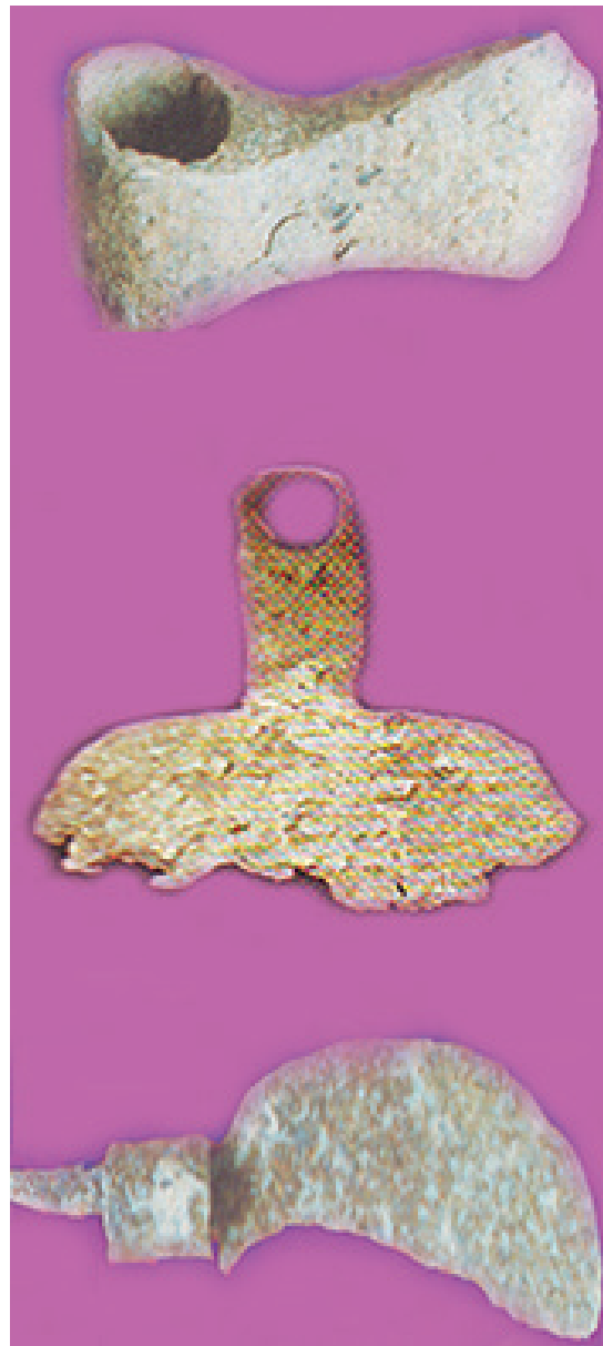
රූපය 1.2 පැරණි යුගයේ භාවිතා කළ කෘෂි උපකරණ කිහිපයක්

හේන් වගා කටයුතු සඳහා කැති, උදලු, දෑ කැති වැනි සරල උපකරණ භාවිත කර ඇත.