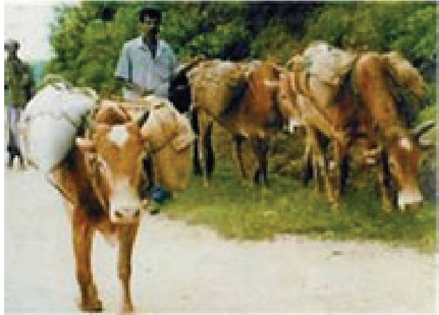
රූපය 1.8 තවලම

බිත්තර, මස් ආදිය ලබා ගැනීම සඳහා කුකුළු පාලනය පැවතිණි. මීට අමතර ව කිරි හා මස් ලබා ගැනීමට එළවන් ඇති කළ බව පෙනේ.