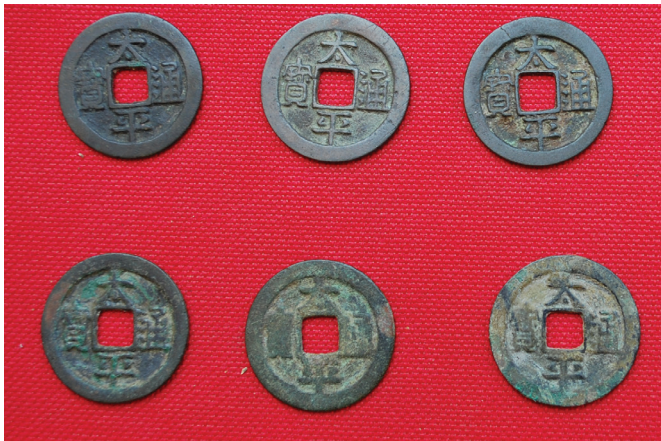
රූපය 1.15 ශ්‍රී ලංකාවෙන් හමුවූ පුරාණ චීන කාසි කිහිපයක්

පුරාවිද්‍යා කැණීම් මගින් අතීතයේ මෙරටට ආනයනය කළ විදේශීය භාණ්ඩවල කොටස්, විවිධ රටවලට අයත් කාසි වර්ග සොයා ගෙන ඇත. අනුරාධපුර රාජධානිය පාලනය කළ භාතිකාභය රජතුමා රුවන්වැලිසෑය අලංකාර කිරීමට සකස් කළ පළඳනාවට අවශ්‍ය පබළු ගෙන්වා ගැනීම සඳහා රෝමයට මෙරටින් දූතයන් යැවූ බව මූලාශ්‍රයවල සඳහන් වේ. මෙම වෙළෙඳ කටයුතු බහුල ව සිදු කළේ මුහුදු මාර්ග ඔස්සේ ය. භාණ්ඩ හා මිනිසුන්