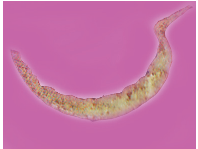
රූපය 1.5 පැරණි දැකැත්තක්

ඊළඟ කන්නයේ වගා කටයුතු ආරම්භ කරන තෙක් පුරාණ ගැමියෝ ආහාර නාස්තිය වලක්වා ගනිමින් අරපිරිමැස්මෙන් වී ප්‍රයෝජනයට ගැනීමේ හොඳ ගුණාංග පුරුදු පුහුණු වී සිටිය හ.