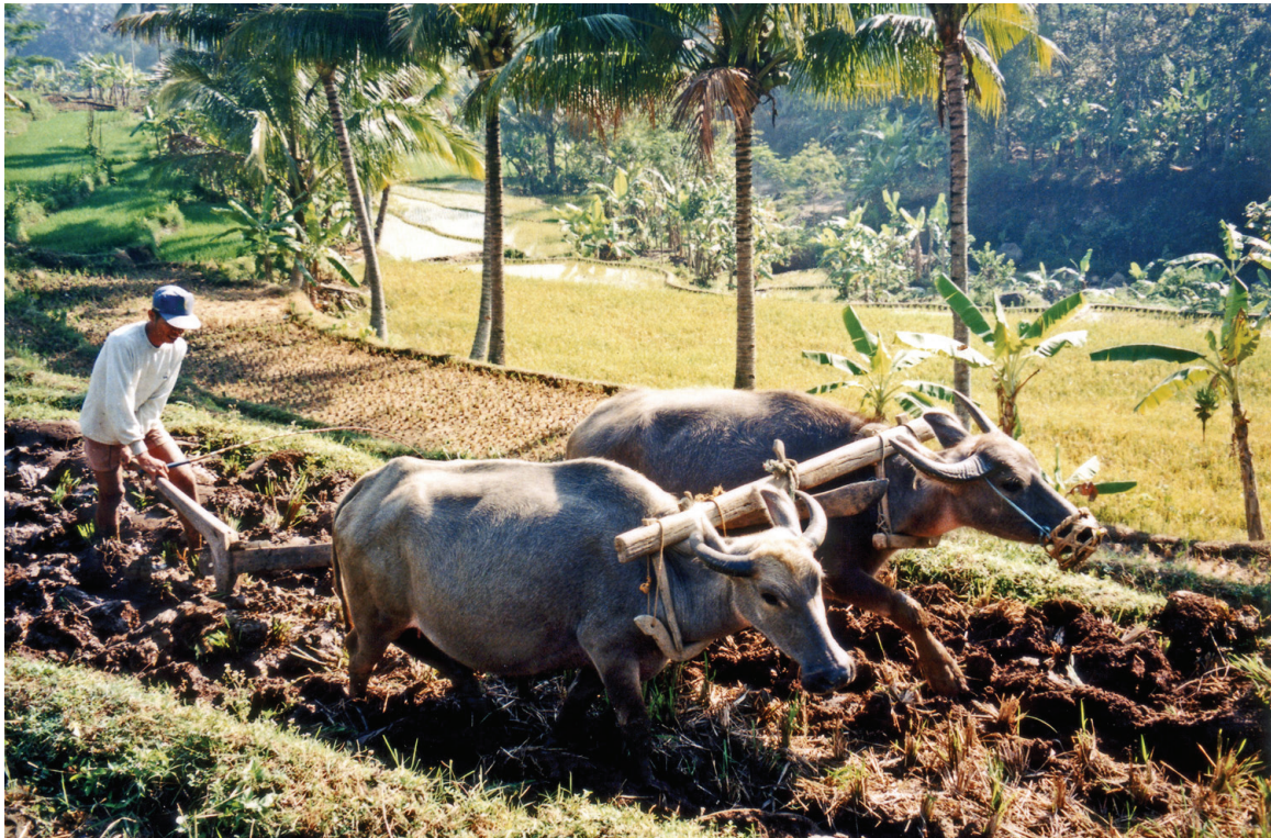
රූපය 1.4 සී සෑම

වගාවට අවශ්‍ය ජලය රඳවා තබා ගැනීමටත් ක්‍රමානුකූලව ජලය පිටකට යැවීමටත් සුදුසු පරිදි ගොවියා විසින් ලියදි සකස් කිරීම සිදු කරන ලදී. මෙසේ කුඹුර සකස් කර ගැනීමෙන් පසුව වී වර්ග වැපිරීම සිදු කෙරිණි.