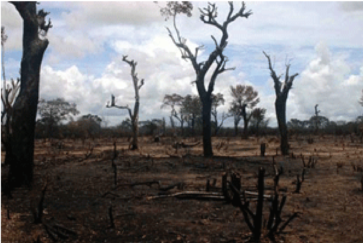
රූපය 1.1 නවදූලිහේන

එවැනි හේන් ඉතා සරුසාර කෘෂි බිම් ලෙස සැලකේ.