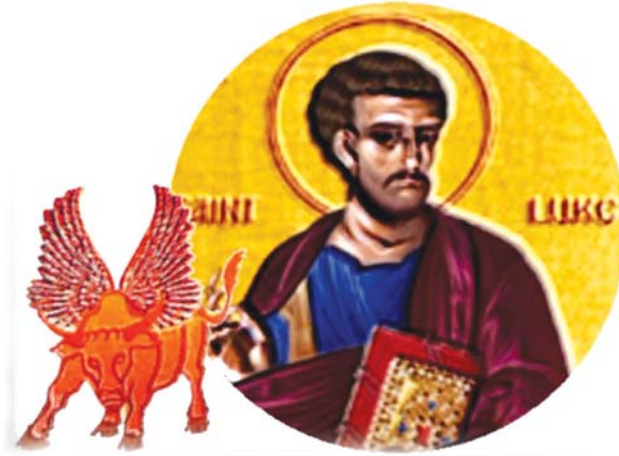
1.1 රූපය - ලුක්තුමා

ටීවර් : පුතේ, දෙවියන් වහන්සේ අපට විශේෂ හැකියා දී තිබෙනවා. ඒවා දියුණු කර ගෙන, අන් අයට සේවය කළ හැකි වැඩදායක පුද්ගලයන් වීම තමයි අපේ වගකීම වෙන්නේ. මම, පුංචි කාලයේ ඉඳලා ම ගුරුවරියක් වෙන්න ආශාවෙන් සිටියේ. මම කැමති උගන්වන්න; දරුවන්ට හොඳ නරක කියලා දෙන්න. ඉතින් අද මම ගුරුවරියක්. අවිශ්ක ඔයාගේ අනාගත බලාපොරොත්තුව මොකක් ද?