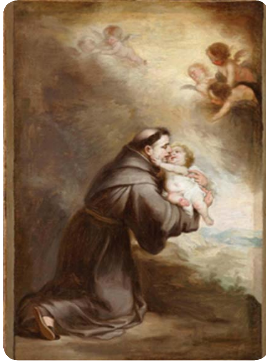
19.1 රූපය - ශුද්ධ වූ අන්තෝනි මුනිකුමා