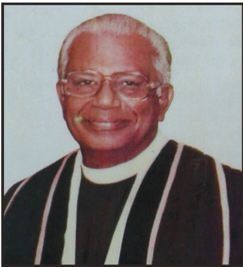
12.3 රූපය - ගෞරවනීය සෝමසිරි කුමාරදස් පෙරේරා දේවගැතිතුමා

මොරටුව, ලුනාව ග්‍රාමයේ 1921 දෙසැම්බර් මස 30 දින උපත ලද ගෞරවනීය සෝමසිරි කුමාරදස් පෙරේරා දේවගැතිතුමා තම මූලික අධ්‍යාපනය ලැබුවේ මොරටුව වේල්ස් කුමර විදුහලෙනි. දේව සේවයට පිවිසීමට පෙර එතුමා රාජ්‍ය සේවයේ රැකියාවක නිරත ව සිටියේ ය. පසු ව එතුමා 1945 වසරේ දී දේව ධර්මය පිළිබඳ අධ්‍යයනය සඳහා බැංගලෝර් හි සෙරෙම්පූර් විශ්වවිද්‍යාලයට ඇතුළත් විය. අනතුරු ව ක්‍රි.ව. 1949 දී ශ්‍රී ලංකා මෙතෝදිස්ත සභාවේ දේවගැතිවරයෙකු ලෙස සේවය ආරම්භ කළේ ය. පසු කලෙක එතුමා පේරාදෙණිය විශ්ව විද්‍යාලයේ කුලාචාර්ය ලෙස තම සේවය සැලසුවේ ය. එම තනතුර දරමින් සේවය කරන අතරතුර දී ම තවත් දේවස්ථාන පහකට ද තම සේවය සලසන්නට ඉදිරිපත් වීම පැසසුම් කටයුතු ය.