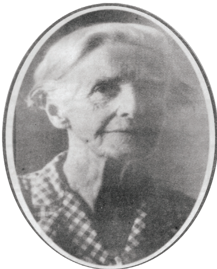
12.1 රූපය - ඉවිලින් කානි

ඉංග්‍රීසි ජාතික කාන්තාවක වන ඉවිලින් කානි එංගලන්තයේ දී උපත ලබා ඇත්තේ ක්‍රි.ව. 1869 පෙබරවාරි මස 23 වන දින දී ය. වයස අවුරුදු විසිහයක තරුණියක ව සිටිය දී එනම් ක්‍රි.ව. 1896 දී ඇය එංගලන්තයේ සිට ලංකාවට පැමිණ ඇත. ඒ ඇය එහි ගත කළ සුව පහසු දිවිය ස්වාමීන් වහන්සේගේ මෙහෙවර උදෙසා කැප කරන්නට ය. එම මෙහෙවර උදෙසා ඇය තෝරා ගනු ලැබූයේ අනුරාධපුරයෙහුත් සැතපුම් අටක දුරින් පිහිටි තලාව නම් දුෂ්කර ගම් පියස යි.