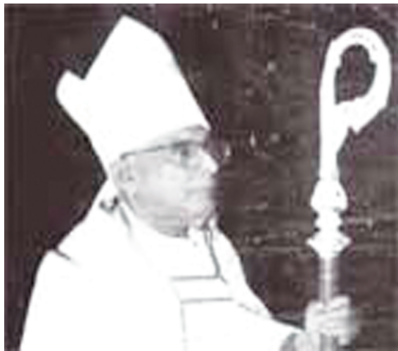
12.2 රූපය - අතිගරු ඇන්ඩෘ කුමාරගේ හිමිපාණෝ

1934 ජනවාරි මස 24 දින උපත ලද අතිගරු ඇන්ඩෘ කුමාරගේ හිමිපාණන් ලංකා සභාවේ කුරුණෑගල දියෝකීසියේ දේවගැතිවරයෙකු ලෙස එකතු වූයේ 1959 මැයි මස 23 වන දින දී ය. ඊට පෙර 1958 මැයි මස 01 දින සිට එතුමා ලංකා සභාවේ දියාකෝන්වරයෙකු ලෙස කටයුතු කළේ ය.