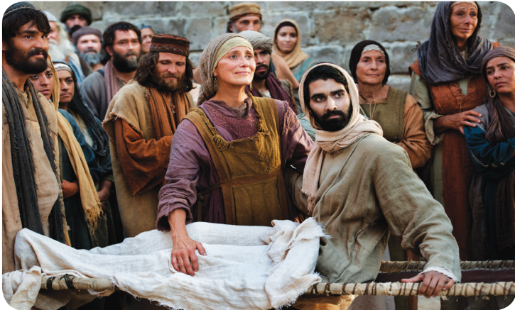
15.1 රූපය - මරණින් නැගිටුවනු ලැබූ පුත්‍රයා නැවත සිය මෑණියන්ට භාර දීම

ජේසුස් වහන්සේ වැන්දඹු කාන්තාව දක, මව කෙරෙහි අනුකම්පා කොට “හැඬීම නවත්වන්නැයි” වදාළ සේක. දෙණට අත තබා “යෞවනය නැගිටින්නැයි මම ඔබට කියමි”යි වදාළ සේක. උන්වහන්සේ මරණින් නැගිටුවනු ලැබූ පුත්‍රයා සිය මෑණියන්ට භාර දුන් සේක. ජේසුස් වහන්සේ සිදුකළ මෙම භාස්කම ජීවිතයට පත් වූ වැන්දඹු කාන්තාවකගේ වේදනාවට ජේසුස් වහන්සේගෙන් ලද සහනයයි ප්‍රතිචාරයකි.