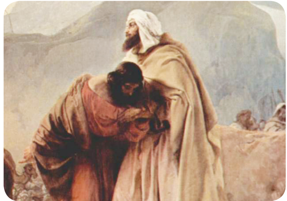
20.2 රූපය - ජාකොබ් සහ ඒසව් සමගි වීම

තම වරද ගැන පසුතැවිලි වන ජාකොබ් සමාව ගැනීමට ඒසව් වෙත පැමිණෙයි. ඒසව් දුටු ජාකොබ් සත් වරක් වැඳ වැටී තම වරද වෙනුවෙන් සමාව අයැදීය. ඒසව් හඬමින් තම සහෝදරයා වැළඳ ගනිමින් ඔහුට සමාව දුන්නේ ය.