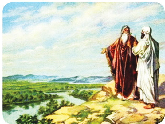
20.1 රූපය - ආබ්‍රහම් ලොත්ට සාරවත් ප්‍රදේශය පරිත්‍යාග කිරීම

කානාන් දේශය කරා ආබ්‍රහම් පිටත් වූයේ ඔහුගේ බිරිඳ වන සාරා සහ ආබ්‍රහම්ගේ සහෝදරයාගේ පුත් වන ලොත් හා ඔහුගේ පවුලේ අය සමගිනි. මේ ගමනේ දී ආබ්‍රහම්ගේ ගොපලුන් හා ලොත්ගේ ගොපලුන් අතර ගැටලු සහගත තත්ත්වයක් ඇති විය. ඔවුන් දෙපිරිස ම පොදුවේ ජීවත් වූ බැවින් සතුන්ට ආහාර ලබා දීමට ප්‍රමාණවත් තණ බිම් නොතිබීම මෙම ගැටලුවට හේතු විය. එම අවස්ථාවේ දී ආදරණීය පියකු මෙන් ක්‍රියා කළ ආබ්‍රහම් ලොත් සමග සාකච්ඡා කොට ප්‍රශ්නය නිරාකරණය කර ගත්තේ ලොත්ට ආබ්‍රහම් කඳුකර ප්‍රදේශයෙහි පදිංචි වීමෙනි.