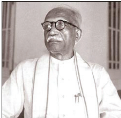
සී. ඩබ්ලිව්. ඩබ්ලිව්. කන්නන්ගර මැතිතුමා

ක්‍රි. ව. 1945 දී නිදහස් අධ්‍යාපනයට අදාළ යෝජනා සම්මත වීමෙන් පසු නිදහස් අධ්‍යාපනය පොදු සේවාවක් ලෙස ශ්‍රී ලංකාවේ ක්‍රියාත්මක විය. නිදහස් අධ්‍යාපනය ශ්‍රී ලංකාවට හඳුන්වා දීමේ ගෞරවය ආචාර්ය සී. ඩබ්ලිව්. ඩබ්ලිව්. කන්නන්ගර මැතිතුමාට හිමි වේ.