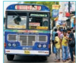
පෞද්ගලික බස් රථයක්