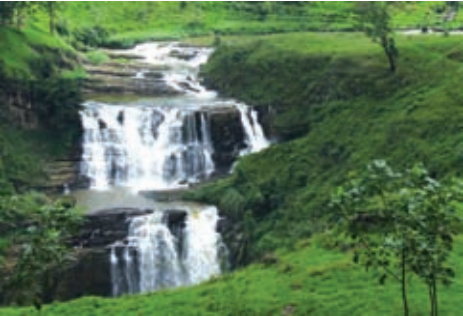
සාන්ත ක්ලෙයාර් දිය ඇල්ල

විවිධ මිනිස් ක්‍රියාකාරකම් පරිසර දූෂණයට ප්‍රබල ලෙස බලපා ඇති අතර මෙය මිනිසා ඇතුළු සියලු ම ජීවින්ගේ පැවැත්මට තර්ජනයක් වී තිබේ. මේ නිසා පරිසර සංරක්ෂණය කෙරෙහි වර්තමානයේ දැඩි අවධානය යොමු වී තිබේ.