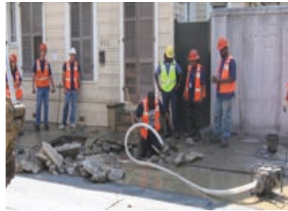
ජල සැපයුමක අලුත්වැඩියාවක් සිදු කරන සේවක පිරිසක්

ජාතික ජලසම්පාදන හා ජලාපවහන මණ්ඩලයේ ප්‍රාදේශීය කාර්යාල මගින් ජල සැපයුම් ලබා දීම, ඒවා නඩත්තු කිරීම, අලුත්වැඩියා කිරීම වැනි කාර්යන් ඉටු කෙරේ.