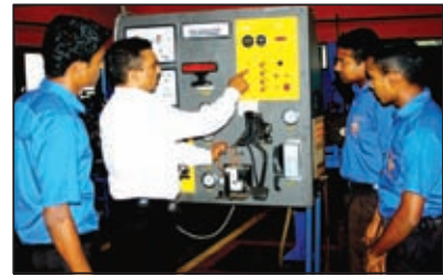
වෘත්තීය අධ්‍යාපන අවස්ථාවක්

මඟින් පූර්ව ළමා විය සංවර්ධන මධ්‍යස්ථාන පවත්වාගෙන යනු ලැබේ.