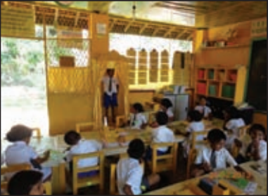
ප්‍රාථමික පන්තියක ඉගෙනුම ලබන සිසුන්