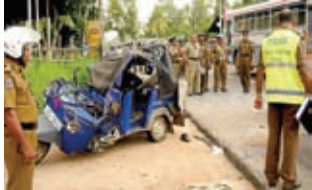
අනතුරක් සිදු වූ ස්ථානයක විමර්ශන සිදු කරන අවස්ථාවක්