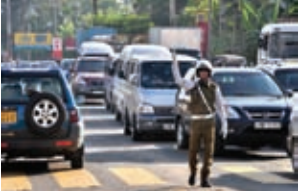
රථ වාහන හැසිරවීමේ යෙදෙන පොලිස් නිලධාරීන්