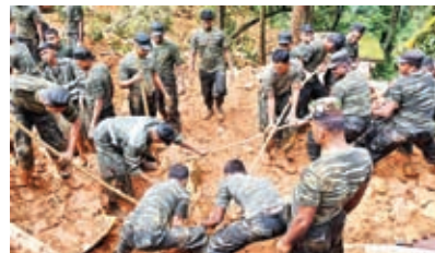
ආපදා අවස්ථාවක ආරක්ෂක හමුදා සේවය ලබාදෙන අවස්ථාවක්