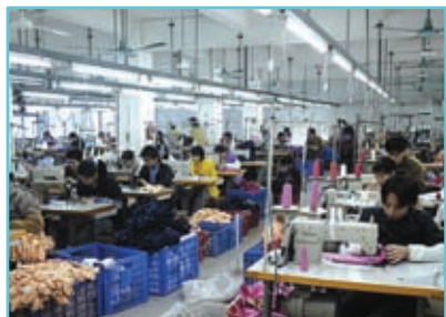
කර්මාන්ත සඳහා විදුලිය