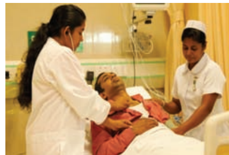
රෝගියෙකුට ප්‍රතිකාර කරන වෛද්‍යවරියක්

මේ වන විට ශ්‍රී ලංකාවේ ළදරු මරණ සංඛ්‍යාව හා මාතෘ මරණ සංඛ්‍යාව පහළ මට්ටමකට ගෙන ඒමට හැකි වී තිබේ. එමෙන් ම ආයු අපේක්ෂාව ද ඉහළ මට්ටමට ගෙන ඒමට හැකියාව ලැබී ඇත. ලාදුරු, මැලේරියාව, පෝලියෝ, බරවා, ක්ෂය රෝගය වැනි රෝග බොහෝ දුරට මර්දනය කිරීමට හැකි වී තිබේ.