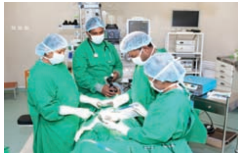
රෝගියෙකුට ශල්‍යකර්මයක් සිදු කරන අවස්ථාවක්

සෞඛ්‍ය සම්පන්න ජාතියක් ගොඩනැගීමට ශ්‍රී ලංකාවේ සෞඛ්‍ය සේවය දායකත්වය සපයයි. රෝග නිවාරණය හා රෝග සුව කිරීම සෞඛ්‍ය සේවාවෙන් ඉටු වන මූලික කාර්යන් වේ. සෞඛ්‍ය සේවය ජනතාවට අත්‍යවශ්‍ය සේවාවක් බැවින් එය නොමිලේ සැපයීමට රජය පහසුකම් සලසා තිබේ.