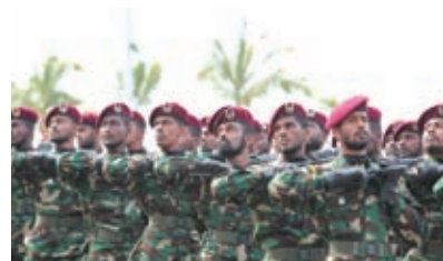
රාජ්‍ය උත්සවයක ආරක්ෂක හමුදා උත්තමාචාර දක්වමින්