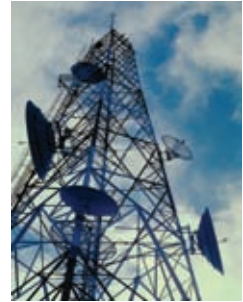
පණිවුඩ හුවමාරු කළුනක්