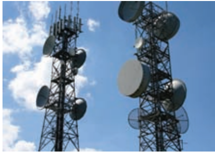
පණිවුඩ හුවමාරු කුලුනක්

ජනතාවගේ ජීවන තත්ත්වය උසස් කිරීම සඳහා පොදු සේවා සැපයීම කාලීන අවශ්‍යතාවකි. ශුභසාධන රාජ්‍යයක් වශයෙන් මෙම කාර්ය ඉටු කිරීම සඳහා රජය මගින් පොදු සේවා රැසක් ලාභ අපේක්ෂාවෙන් තොරව ක්‍රියාත්මක කරනු ලබයි. පෞද්ගලික අංශය මුදල් අය කිරීමේ පදනම මත මෙම සේවා සැපයීමට දායක වේ.