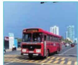
ශ්‍රී ලංගම බස් රථයක්

ආදි අවශ්‍යතා සඳහා ප්‍රවාහන සේවා අපට ප්‍රයෝජනවත් වේ. අගනුවර ඇතුළු නාගරික ප්‍රදේශවල බොහෝවිට වාහන තදබදයක් ඇති වේ. මෙම වාහන තදබදය අඩු කර ගැනීම සඳහා ද පොදු ප්‍රවාහන සේවා භාවිතයට ගැනීම කාලීන අවශ්‍යතාවක් බවට පත් වී තිබේ. ප්‍රවාහන අවශ්‍යතා ඉටු කර ගැනීම සඳහා පෞද්ගලික වාහන වෙනුවට පොදු ප්‍රවාහන සේවා ප්‍රයෝජනයට ගැනීමෙන් මුදල් ඉතිරි කර ගැනීමට ද හැකි වේ.