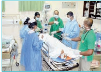
රෝහල් සඳහා විදුලිය

එම අදහස්වලින් පෙනී යන්නේ කාර්මික හා තාක්ෂණික දියුණුවත් මිනිස් අවශ්‍යතා සංකීර්ණ වීමත් සමග විදුලිය වර්තමාන ජන සමාජයට අත්‍යවශ්‍ය සේවාවක් වී ඇති බවයි. 2015 වර්ෂය වන විට ශ්‍රී ලංකාවේ විදුලි බලය සඳහා ඇති ප්‍රවේශය 98.5% කි (වාර්ෂික වාර්තාව 2015 - ශ්‍රී ලංකා මහ බැංකුව). අනාගතයේ දී සියලු ම නිවාස සඳහා විදුලිය සැපයීම රජයේ ඉලක්කය වී තිබේ.