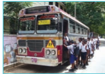
සිසු සැරිය බස් රථයක්

පාසල් සිසුන් සඳහා ප්‍රවාහන පහසුකම් සැපයීමට පෞද්ගලික අංශ ද දායකත්වය සපයයි.