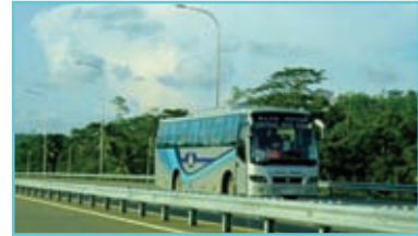
අධිවේගී මාර්ගවල ධාවනය වන සුබෝපහෝගී බසයක්