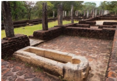
පැරණි රෝහලක නටබුන්