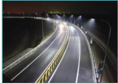
විටී සඳහා විදුලිය