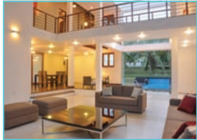
නිවෙස් සඳහා විදුලිය

ශ්‍රී ලංකාවේ බොහෝ ප්‍රදේශවලට ලංකා විදුලිබල මණ්ඩලය විදුලිය සපයයි. ලංකා විදුලි (පෞද්ගලික) සමාගම ද විදුලිය සැපයීමට දායක වේ.