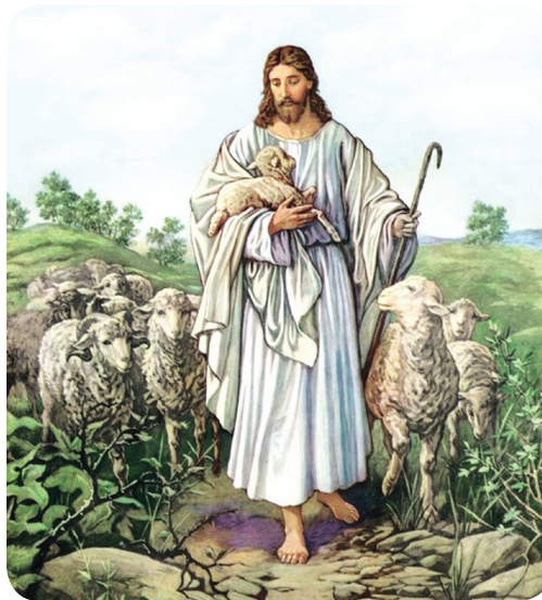
5.2 රූපය - යහපත් එඬේරා

බැටළු එඬේරෙකු බැටළුවන් මෙහෙය වන්නේ ඉදිරියෙන් ගමන් කරමිනි. එඬේරෙක් එසේ කරනුයේ බැටළුවන්ට අවැසි ආරක්ෂාව හා මඟපෙන්වීම තහවුරු කරනු සඳහා ය. ජේසුස් ක්‍රිස්තුන් වහන්සේ යහපත් එඬේරෙක් ලෙස අපට මඟපෙන්වීම ලබා දෙයි. අපි උන්වහන්සේට කීකරු යහපත් බැටළුවන් වෙමු.