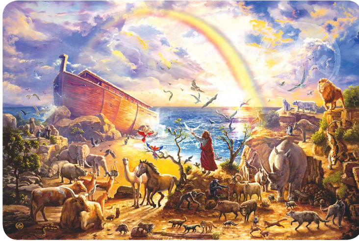
8.3 රූපය - ජල ගැල්ම

නෝවාට වයස අවුරුදු හයසියයේ දී දෙවන මාසයේ හරියට ම දාහත් වන දින මහා සමුද්‍රයේ සියලු උල්පත් බිඳී ජලය ගලා ගියේ ය. අහසේ කවුළු විවෘත විය.