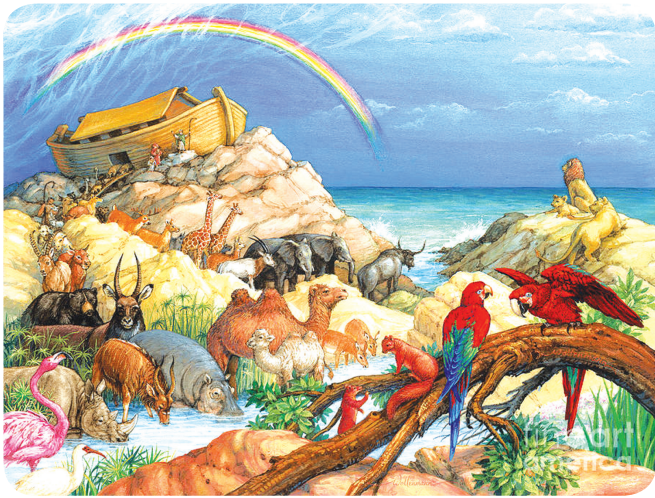
8.4 ජල ගැල්මෙන් පසු

මා හා නුඹලා ද, සියලු ජීවමාන සතුන් ද අතර මින් මතු කවදාවත් ජල ගැල්මකින් සියලු ජීවමාන සතුන් විනාශ නොකිරීමට පිහිටුවා ගත් ගිවිසුම සිහි කරන්නෙමි. (උත්පත්ති 9:15)