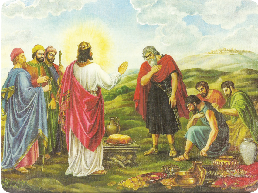
8.2 රජය - නෝවා පුතුන් සමග

උන්වහන්සේ අඛණ්ඩවෙහි නෝවා කරුණාව ලැබී ය. .... ඔහු සන්ගුණවත් මිනිසෙකි. ඔහුගේ පරම්පරාවේ නිදොස් මිනිසා ඔහු විය. ඔහු දෙවියන් වහන්සේ සමග සුභදතාවෙන් හැසුරුණේ ය. තවද, ඔහුට ඡෙම්, හාම්, ජපෙන් කියා පුත්තු තිදෙනෙක් උපන්න.