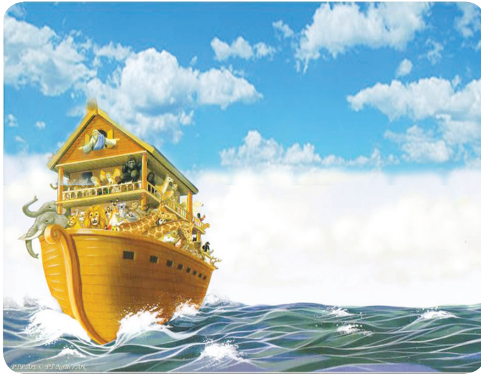
81. රූපය - නෝවාගේ නැව

ලෝ වැසි සෙසු හැම දෙන ම දෙවියන් වහන්සේ අබ්ලිවෙහි දූෂ්‍ය වී සිටියහ; ඔව්හු සැහැසිකමින් පිරී සිටියහ. දෙවියන් වහන්සේ ලෝකය දෙස බලා එය දූෂ්‍ය වී ඇති බව දුටු සේක. මිහිපිට මිනිසාගේ කල්කියා දරුණු ලෙස දූෂ්‍ය වී තිබුණේ ය.