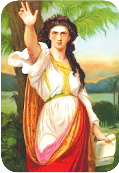
9.1 රූපය - දෙබෝරා නම් වීර නායිකාව

දෙබෝරා ඉතා නැණවත් කාන්තාවකි. ඇයගේ කාලයේ දී කානානීය රජෙක් ඉශ්රායෙල්වරුන්ට පීඩා කළේ ය. එම පීඩා නිසා ඉශ්රායෙල් ජනතාව දෙවියන් වහන්සේට මොර ගැසූහ. දෙබෝරාගේ උපදෙස් පරිදි බාරාක් විසින් දස දහසක් වූ සේනාවක් කානානීය හමුදාවට විරුද්ධ ව මෙහෙයවන ලදී. බාරාක්, තාබෝර් කන්දට පැමිණි බව දනගත් කානානීයවරු ඔවුන් හා සටනට සුදනම් වූහ. කානානීය හමුදාවට විරුද්ධ ව යුධ වැදීමට ඉශ්රායෙල් හමුදාපති බාරාක් ව දෙබෝරා දිරි ගැන්වූවා ය. දෙවියන් වහන්සේගේ වරප්‍රසාදය නිසා ඉශ්රායෙල් හමුදාව ජයග්‍රහණය කළේ ය. මේ ජය ඉශ්රායෙල් හමුදාවේ ජයග්‍රහණයක් නොවන බවත් එය ලබා දුන්නේ දෙවි ස්වාමීන් වහන්සේ බවත් දෙබෝරා ඔවුනට වටහා දුන්නා ය.