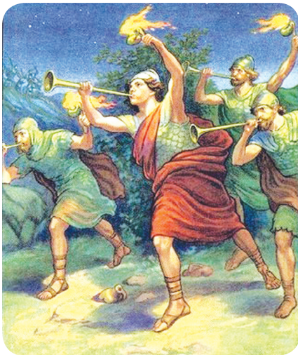
9.2 රූපය - ගිඩියොන් නම් වීර නායකයා

සතලිස් වසරක සාමකාමී කාලයකින් පසු යළිත් ජුදා වංශය දෙවියන් වහන්සේට විරුද්ධ ව පව් කළ නිසා එයට දඬුවමක් ලෙස ඔවුන්ට මිදියන්වරුන්ගෙන් පීඩා විඳින්නට සිදු විය. ඔවුන්ට සහනය සලසන මෙන් දෙවියන් වහන්සේගෙන් ඉල්ලා සිටියෙන් ඒ සඳහා වීර නායකයකු ලෙස ගිඩියොන් කැඳවනු ලැබී ය.