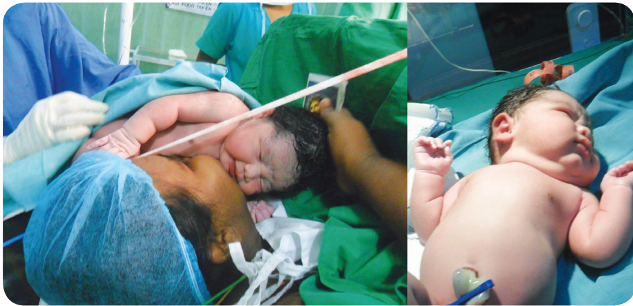
17.2 රූපය - මෙලොව එළිය දුටු මොහොතක දරුවෙකු

පින්තූර දෙස අවධානයෙන් බලන්න. තමන්ගේ මව දස මසක් කුසේ දරා ගෙන මොලොවට ඔබ බිහි කළ බව සිහිපත් කරන්න. එම නිසා ඔබේ මවට හා පියාට ස්තූති කරන්න. ඔබ මව් කුස පිළිසිද ගත් මොහොතේ සිට මේ දක්වා ආරක්ෂා කර රැක බලා ගත්තාටත් ස්තූති කරන්න.