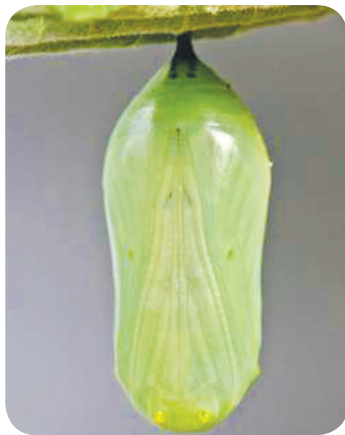
කෝෂය තුළ නව ජීවිතයකට සූදානම් වන දළඹුවා

මෙය ක්‍රිස්තුස් වහන්සේ තුළ නව ජීවිතයක් ආරම්භ කිරීමට පෙර අප ගත කරන ජීවිතයට සමාන කළ හැකි වේ.