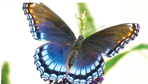
සමනලයකු ලෙස නව ජීවිතයක් අත්කර ගැනීම

ක්‍රිස්තුස් වහන්සේ අත් දැකීමට පෙර අපගේ පාපය අවබෝධ කර ගනිමින් හා නව ජීවිතයක් අවශ්‍ය බව තේරුම් ගනිමින් ඒ සඳහා සූදානම් වන අවස්ථාවකට සමාන වේ.