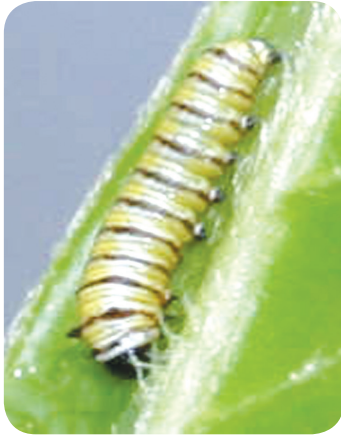
දළඹුවෙකු ලෙස ජීවත් වීම

නව ජීවිතයක් අපේක්ෂාවෙන් සිටින සමනලයෙකුගේ ජීවිතයේ අවස්ථා තුනක් පහත රූපවලින් ප්‍රකාශ වේ.