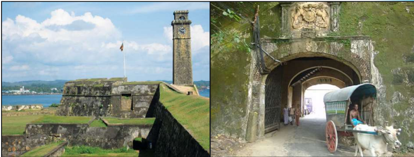
1.3 රූපය - ගාලු කොටුව

ලන්දේසීන් මුල සිට ම අතිශය කපටි අන්දමින් රජු සමඟ කටයුතු කොට ඇත. 1638 ගිවිසුමේ එක් වගන්තියකට අනුව පෘතුගීසීන්ගෙන් අල්ලා ගනු ලබන බලකොටුවල “ලන්දේසි හමුදා නතර කළ යුතු වන්නේ උඩරට රජු කැමති නම් පමණි” යන අදහස පැවතියත්, ලන්දේසීහු එම වගන්තිය අමතක කොට කටයුතු කළහ. ඒ අනුව තමන් අල්ලාගත් බලකොටුවල රජුගෙන් නොවිමසා ලන්දේසීහු තම භටයන් නතර කළහ. මීගමුව හා ගාල්ල කුරුඳු බහුලව වැවෙන ප්‍රදේශ වූ හෙයින් ඒවා රජුට භාර නොදී තමන් සතුව තබා ගැනීමට ලන්දේසීහු කටයුතු කළහ. මෙම මතභේදය නිසා බලකොටුවල සිටින සේවකයන්ට වැටුප් ගෙවීම රජුගේ වගකීමක් නොවන බව රජතුමා කියා සිටියේ ය. ඒ අතර ඉල්ලා සිටි යුධ වියදම් ගෙවන තුරු බලකොටු රජුට පවරා දිය නොහැකි බව ලන්දේසීහු ද කියා සිටියහ. මෙසේ දෙපක්ෂය අතර මතභේදය ක්‍රමයෙන් උග්‍ර විය. එහෙත් කොළඹ ඇතුළු බලකොටුවලින් පෘතුගීසීන් පලවා හැරීමට ලන්දේසි සහාය අවශ්‍ය වූ බැවින් දෙවන රාජසිංහ රජු බොහෝ ඉවසිලීමත්ව කටයුතු කළ බව පෙනේ.