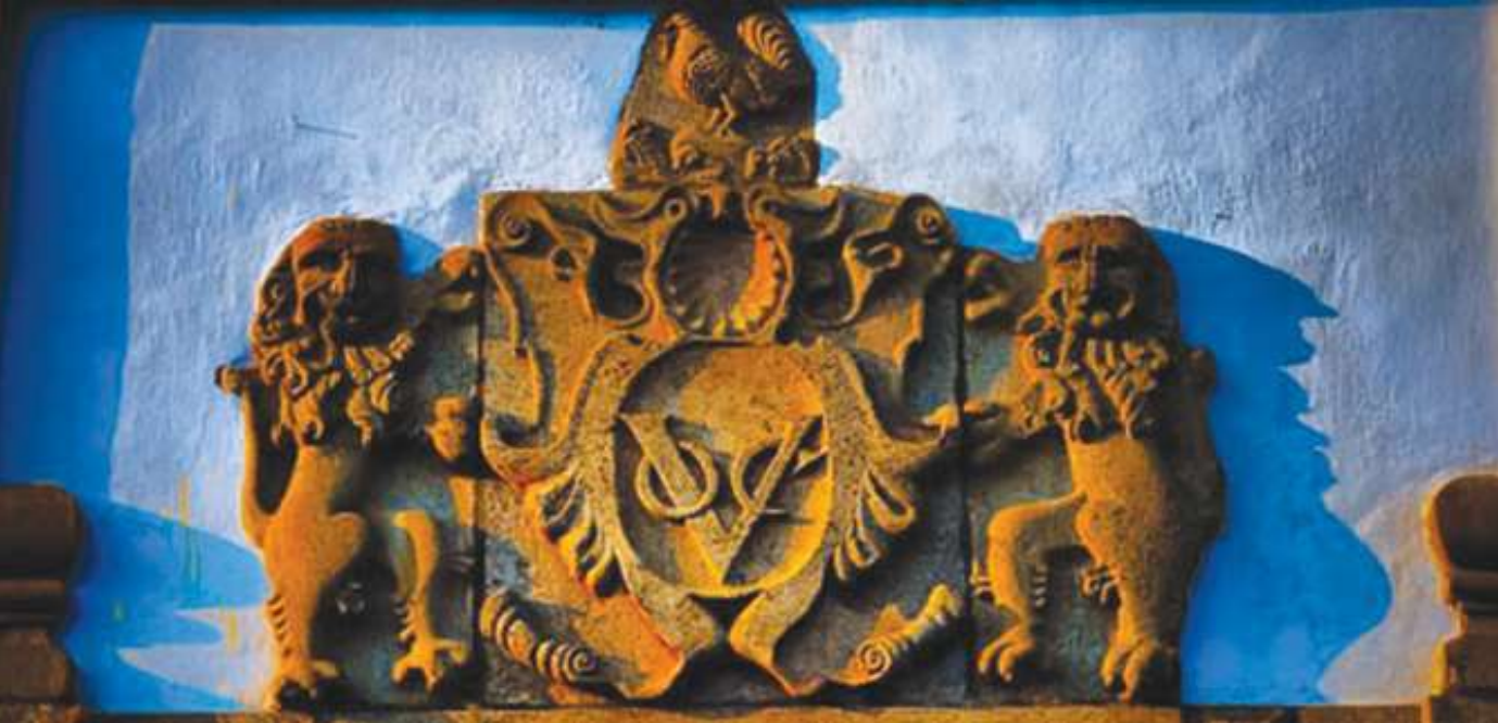
1.1 රූපය - පෙරදිග ඕලන්ද වෙළෙඳ සමාගමේ (VOC) ලාංඡනය

පෘතුගීසීන් ආසියාවට පැමිණ ශතවර්ෂයක් ගත වන තෙක් තමන් පැමිණෙන මුහුදු මාර්ග පිළිබඳ දැනුම සෙසු යුරෝපීයන් අතට පත්වීම වැලැක්වීමට පියවර ගෙන ඇත. එම කාලයේ දී පෘතුගීසීන්ට ඉතා විශ්වාසදායක අය හැරුණු විට සැක කටයුතු ලන්දේසී, ඉංග්‍රීසි හෝ ප්‍රංශ ජාතිකයෙකුට පෘතුගීසී නැවක ආසියාවට පැමිණීමට වත් පෘතුගීසීහු ඉඩ නොදුන්හ. එහෙත් ලන්දේසීහු විවිධ ඔත්තුකරුවන් යෙදවීම හා වෙනත් මාර්ගවලින්