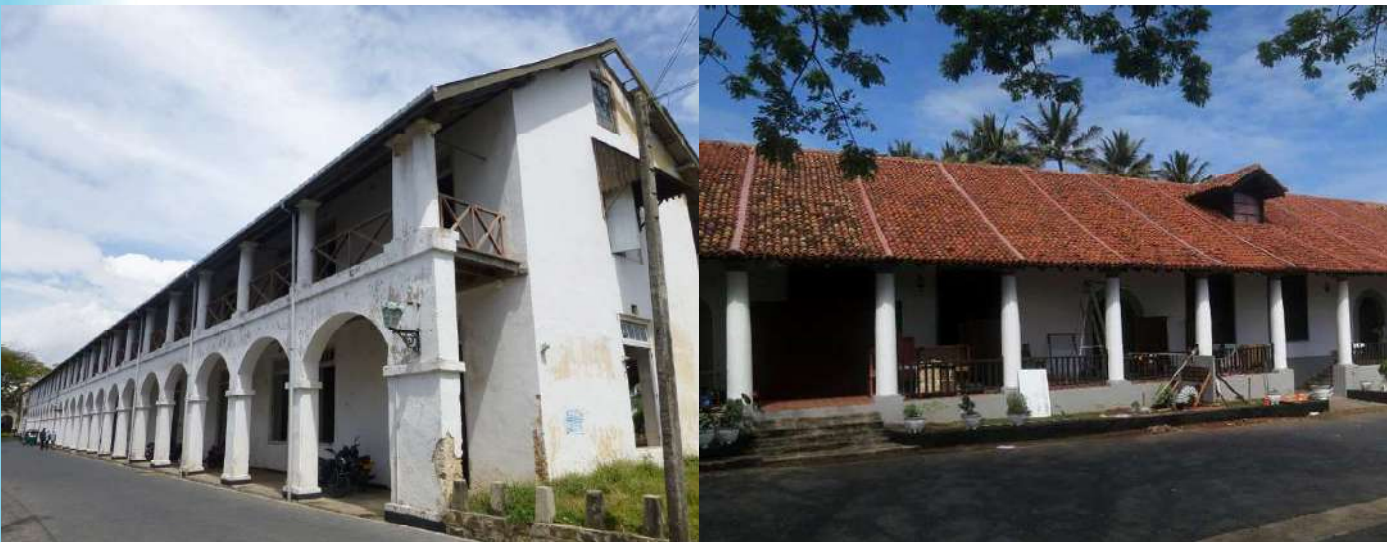
1.8 රූපය - ලංකාවේ ඕලන්ද ගෘහ නිර්මාණ