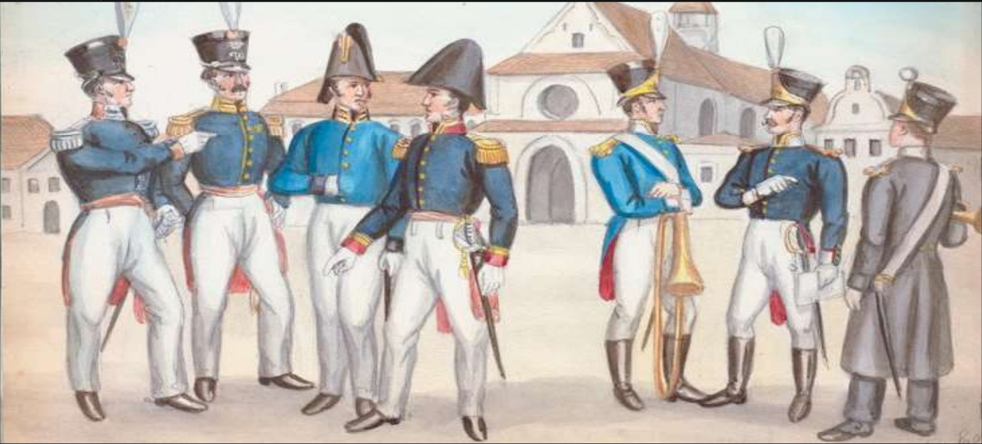
1.6 රූපය - ඕලන්ද සොල්දාදුවන් දැක්වෙන සිතුවමක්

ශ්‍රී විජය රාජසිංහ රජුගෙන් පසු 1747 වර්ෂයේ දී එතුමාගේ නායක්කර් වංශික බිසවගේ සහෝදරයා කීර්ති ශ්‍රී රාජසිංහ නමින් සිහසුනට පත් විය. මෙතුමා එවකට පරිහානියට පත්ව තිබූ බුදුසසුන නගා සිටුවීමට කාර්යන් රාශියක් සිදු කළේ ය. වැලිවිට සරණංකර හිමියෝ මේ සඳහා රජුට අනුශාසනා ලබාදුන්හ. රජතුමා ලන්දේසීන්ගෙන් නැව් ලබාගෙන උපසම්පදාව ගෙන ඒම සඳහා සියම් දේශයට දූත කණ්ඩායමක් පිටත් කළේ ය.