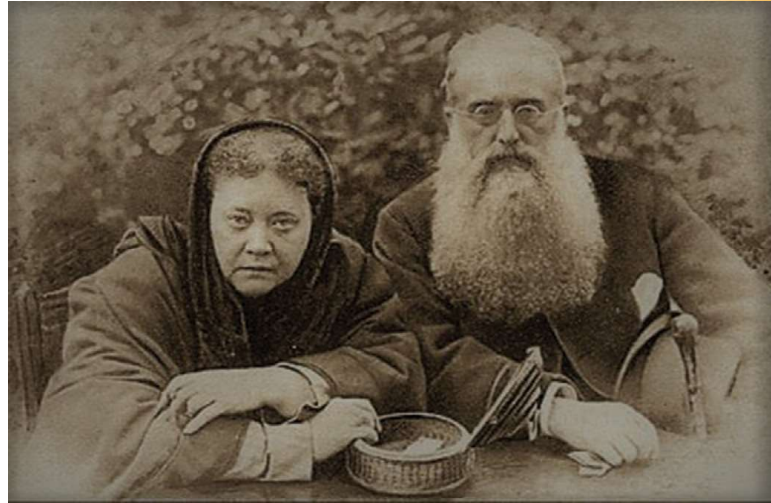
3.3 රූපය - ඕල්කොට්තුමා හා හෙල්නා බ්ලැවැට්ස්කි මැතිනිය

පාසල් පිහිටුවීමට හා පවත්වාගෙන යාමට අවශ්‍ය අරමුදල් නොමැති වීම හා සංවිධාන ශක්තිය ප්‍රමාණවත් නොවීම නිසා එතෙක් කල් බෞද්ධයන්ට පාසල් පිහිටුවීමට හැකියාවක් නොතිබුණි. හෙන්රි ස්ටීල් ඕල්කොට්තුමා මෙරට බෞද්ධ පාසල් පිහිටුවීමට පෙරමුණ ගෙන ක්‍රියා කළේ ය. ගිහි පැවිදි උගතුන් රාශියක් ද මේ සඳහා ක්‍රියාකාරීව කටයුතු කළහ. එබඳු නායකයන් කිහිප දෙනෙකුගේ නම් පහත දැක්වේ.