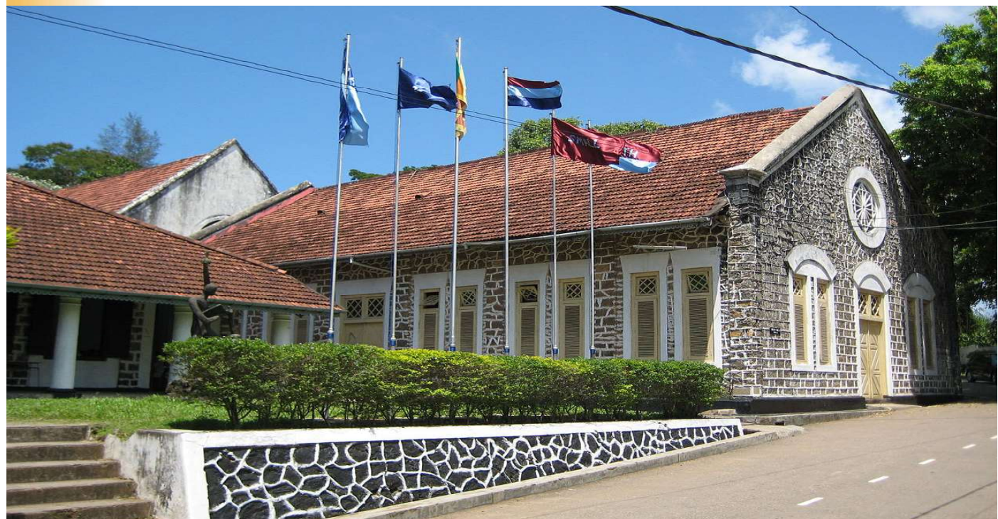
3.1 රූපය - ගාල්ල රවිමන්ඩ් විද්‍යාලය (1814 වර්ෂය දී වෙස්ලියන් මිෂනාරින් විසින් ඉදි කර ඇත)