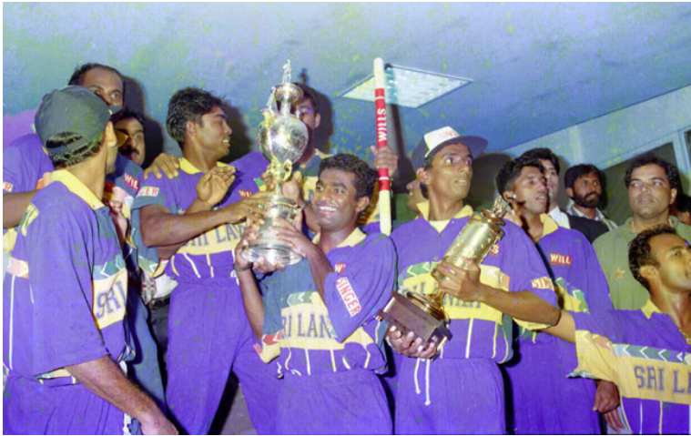
2.2 රූපය - ක්‍රීඩාවේ ප්‍රවීණයෙකු වීම

ඔබ සතු හැකියාවන්ගෙන් එකක් හෝ කිහිපයක් දියුණු කිරීමෙන් ඔබට එහි ප්‍රවීණයෙකු වීමට හැකි බව නිසැක ය. මෙසේ එකිනෙකාට අනන්‍ය වූ හැකියාවන් ඕනෑම පුද්ගලයෙකු සතු ය. මෙම හැකියාවන් විභව ශක්තීන් ලෙස හඳුන්වයි. අප තුළ ඇති විභව ශක්තීන්ට අනුව යම් ඉලක්කයක් හඳුනාගෙන අන් අයට කරදරයක් බාධාවක් නොවන සේ ඒවා සපුරා ගැනීමට අප උත්සාහ කළ යුතු ය. එ මගින් සමාජයට, රටට සේවයක් මෙන් ම කීර්තියක්, ගෞරවයක් ලබා දීමට අපට හැකි වේ. එවිට තමා තුළ ද කිසියම් සතුටක්, තෘප්තියක් හා අභිමානයක් ඇති වේ. එසේ ලැබෙන තෘප්තිය, සතුට, අභිමානය ආත්මසාක්ෂාත්කරණය ලෙස සරලව දැක්විය හැකි ය.