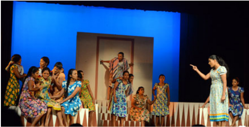
2.1 රූපය - සෞන්දර්යාත්මක කුසලතා