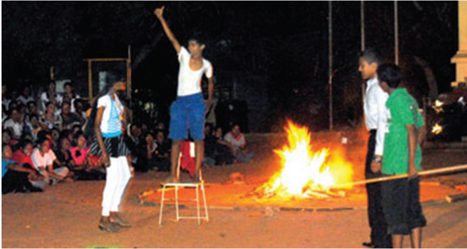
14.9 රූපය - ගිනිමැළ සංදර්ශනයක්

බොහෝ අවස්ථාවල දී ගිනිමැළ දැල්වීම සැණකෙළියක ස්වරූපයෙන් ද සිදු කරනු ලැබේ. ඒවා ගිනිමැළ සංදර්ශන ලෙස හැඳින්වේ.