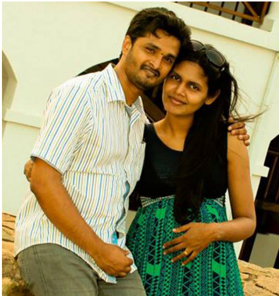
20.5 රූපය - බිරිඳට ආදරය, සෙනෙහස හා ආරක්ෂාව ලබා දීම