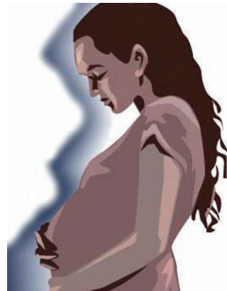
20.3 රූපය - අනපේක්ෂිත ගැබ් ගැනීම්