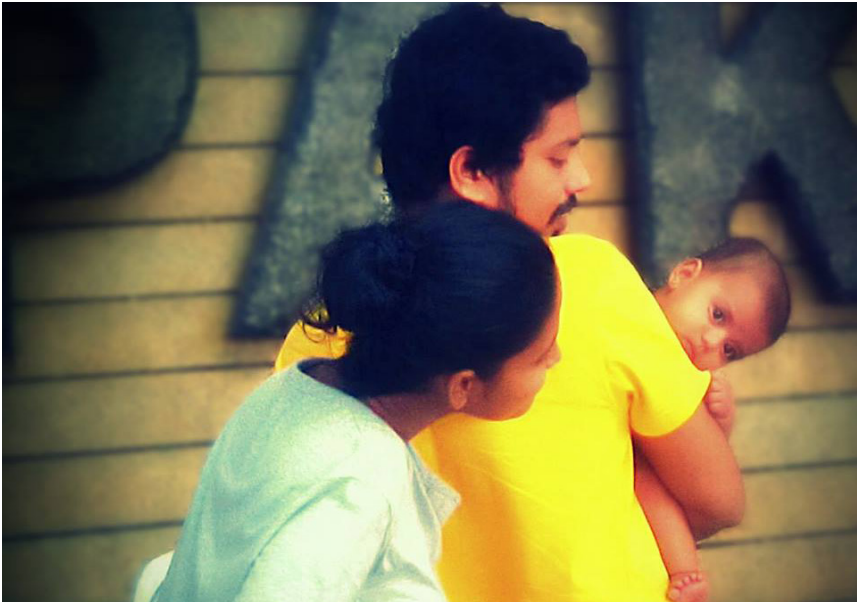
20.2 රූපය - ස්ත්‍රී පුරුෂ හේදයකින් තොරව කටයුතු කිරීම

ඉහත සිදුවීමේ දක්වූ පරිදි අවස්ථාවට සුදුසු ලෙස ස්ත්‍රී පුරුෂ හේදයක් නොමැතිව කටයුතු කිරීමෙන් නිවස තුළ වගකීම් සාධාරණව බෙදී ගොස් පවුලේ කටයුතු සාර්ථක වේ. 'ගැහැණු වැඩ' හෝ 'පිරිමි වැඩ' ලෙස හේදයක් නොමැතිව මෙලෙස සමානව වගකීම් බෙදාගෙන කටයුතු කිරීම පවුලේ සියලු දෙනාගේ ම යහපතට හේතු වේ. ඔබ ද නිවසේ දී හා පාසලේ දී එසේ කටයුතු කිරීමට පුරුදු වන්න.