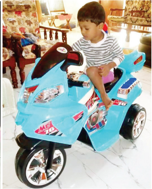
20.1 රූපය - ස්ත්‍රී පුරුෂ භාවය අනුව සෙල්ලම් බඩු වර්ගීකරණය

එදා සෙනලි පාසල් ඇරී ගෙදර එන විට තාත්තා කුස්සියේ උයනවා. ‘අත්තම්මාට අසනීප නිසා අම්මා ඒ ගැන බලන්න ගියා. අද මම තමා ගෙදර වැඩ බලා ගත්තේ’, තාත්තා කීවා. සෙනලි තාත්තාට උයා අස් කරන්න උදව් කළා. දෙදෙනා ම එකතු වී රෙදි ටික සෝදා දුම්මා. තව ටික වේලාවකින් පාසල් ඇරී අයියාත් ගෙදර ආවා. ඔහු, ගේ අතු ගැවා. වේලුණු ඇඳුම් ටික නවා අස් කර දුම්මා.