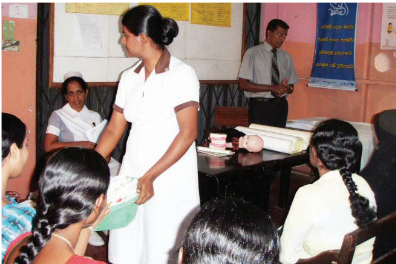
20.4 රූපය - සෞඛ්‍ය සායන සඳහා සහභාගී වීම