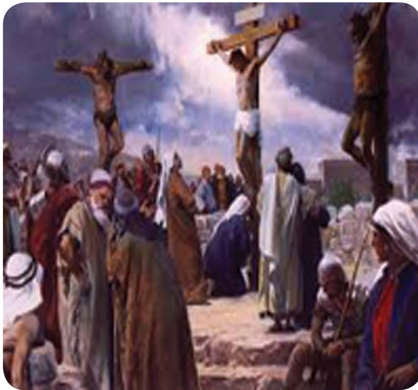
6.2 රූපය - ජේසුස් වහන්සේගේ උකුත් වීම

ජේසුස් වහන්සේගේ කර පිට තැබූ කුරුසිය උසුලා ගෙන යාමට සහාය වන්නේ සිරේනියේ සීමොන් ය. විශාල ජනකායක් ඔවුන් වහන්සේ පසුපස ගියහ. කපාල පිටිය නම් ස්ථානයට පැමිණි විට සෙබළු ජේසුස් වහන්සේ ව ද ඔවුන් වහන්සේ දෙපසින් සොරුන් දෙදෙනකු ද කුරුසියේ ඇණ ගැසූහ. එම අවස්ථාවේ ඔවුන් වහන්සේ, “පියාණෙනි, ඔවුන්ට කමා වුව මැනව; ඔවුන් කරන දෙය ඔව්හු