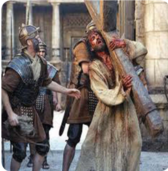
6.1 රූපය - ජේසුස් වහන්සේගේ දුක්ප්‍රාප්තිය

ජේසුස් වහන්සේගේ දුක්ප්‍රාප්තිය (ලූක් 22:54-23:25)