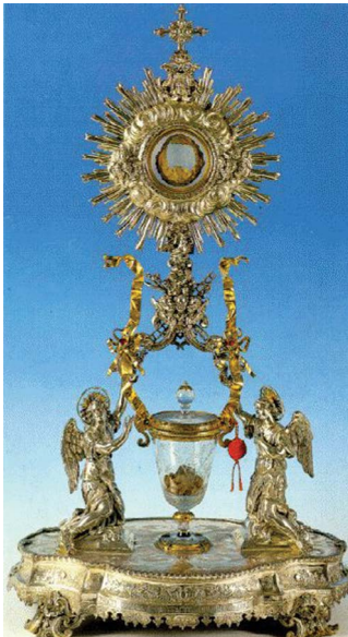
12.2 රූපය - දිව්‍ය සත්ප්‍රසාද වහන්සේ

ක්‍රි.ව. 800 දී පමණ ඉතාලියේ ලන්වියානෝ නුවර ශුද්ධ වූ ලෙගොන්ෂියන් මුනිතුමාට කැප කරන ලද කුඩා දෙව් මැදුරේ සේවය කළ එක්තරා තාපස පියතුමෙක් දිව්‍ය පූජාව පවත්වන විට, පූජා හා මිදියුස ජේසුස් වහන්සේගේ ශ්‍රී ශරීරයට හා ශ්‍රී රුධිරයට හැරෙන්නේ දූ'යි සැක කළේ ය. දිනක් එතුමා දිව්‍ය පූජාවේ දිව්‍ය රහස් කරන මොහොතේ පූජය මස් කැබැල්ලක් බවටත් මිදියුස රුධිරය බවටත් පත්වන බව දිවි ය. එම මස් කැබැල්ල හා රුධිරය ලන්වියානෝ නුවර විශේෂ දිව්‍ය සත්ප්‍රසාද කරඬුවක තැන්පත් කර ඇත.