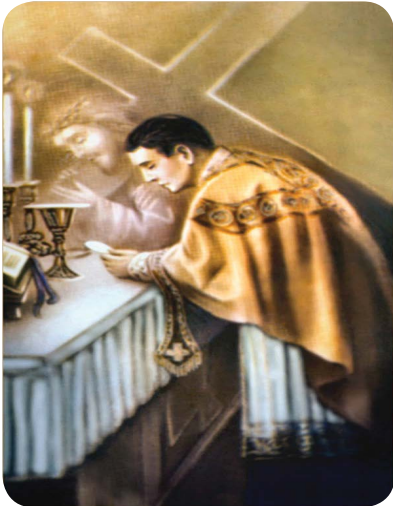
14.2 රූපය - පූජා හා මිදිසුස දිවරහස් කිරීම

“උන් වහන්සේ එළවන්ගේත් වස්සන්ගේත් ලෙයින් නොව, තමන්ගේ ම ලෙයින් අප උදෙසා සදහන විමුක්තිය ලබා සදහට ම එක වරක් ශුද්ධස්ථානයට ඇතුළු වූ සේක. .... දෙවියන් වහන්සේට පූජා වූ ක්‍රීස්තුන් වහන්සේගේ ලේ කරණකොටගෙන, ඊටත් ඉතා වැඩියෙන් පිරිසිදු නොවන්නේ ද?” (හෙබ්‍රෙව් 9:12-14)