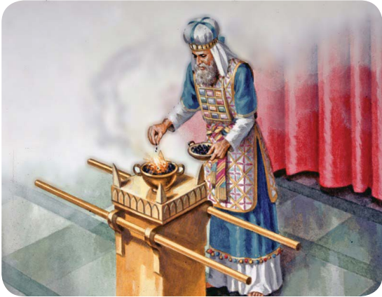
14.1 රූපය - පුරාණ ගිවිසුමේ දුම් පූජාවක් සිදු කිරීම

පුරාණ ගිවිසුමේ වන්දනාවේ කේන්ද්‍රීය ක්‍රියාව, යාග පූජා පුද කිරීම ය. මෙම යාග පූජා සඳහා ආහාරපාන හා සතුන් යොදා ගැනුන ද එයින් වඩාත් ම වැදගත් වූයේ, සත්ත්ව පූජා ය. මන්ද සත්ත්වයාගේ රුධිරය තුළ ජීවිතය අන්තර්ගත වූ බැවින් හා ජීවිතය දෙවියන් වහන්සේට අයිති වූ බැවින් ය (ලෙවි 3:17, 7:26, 17:10, 17:11).