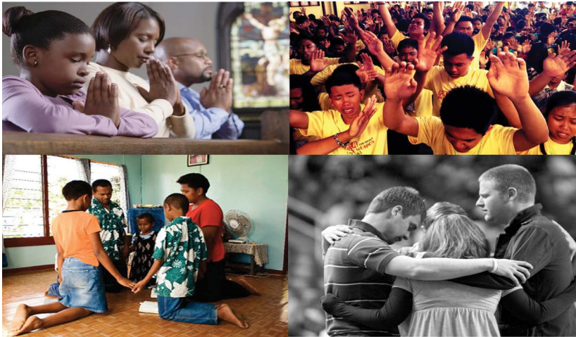
16.1 රූපය - යැදුම තුළින් මුළුමනින් ම දෙවියන් වහන්සේ හා ඒකාබද්ධ වීම

විශ්වාසය, බලාපොරොත්තුව හා ප්‍රේමය පළමු පනත හා අත්වැල් බැඳගෙන යාවිඤ්ඤාව තුළ සම්පූර්ණත්වයට පත් වන්නේ ය. යාවිඤ්ඤාවේ දී වන්දනාව, ප්‍රශංසාව, ස්තූති කිරීම, මැදිහත් වීමේ යැදුම් හා ඉල්ලීම් මගින් අප හදවත (මනස) දෙවියන් වහන්සේ වෙත ඔසවනු ලබයි. අපි සැමවිට අධෛර්ය නොවී නොකඩවා යාවිඤ්ඤා කරමු. (ලූක් 18:1) කතෝලික සභා ධර්මෝපදේශය 2098