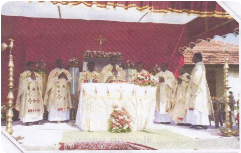
16.3 - රූපය දිවා පූජා යාගය

ඉරුදින ශුද්ධවත් ලෙස ගත කිරීම සඳහා අප විසින් සිදු කළ යුතු පළමු ණය යුතුකම වන්නේ දිවා පූජාවට සහභාගි වීම ය.