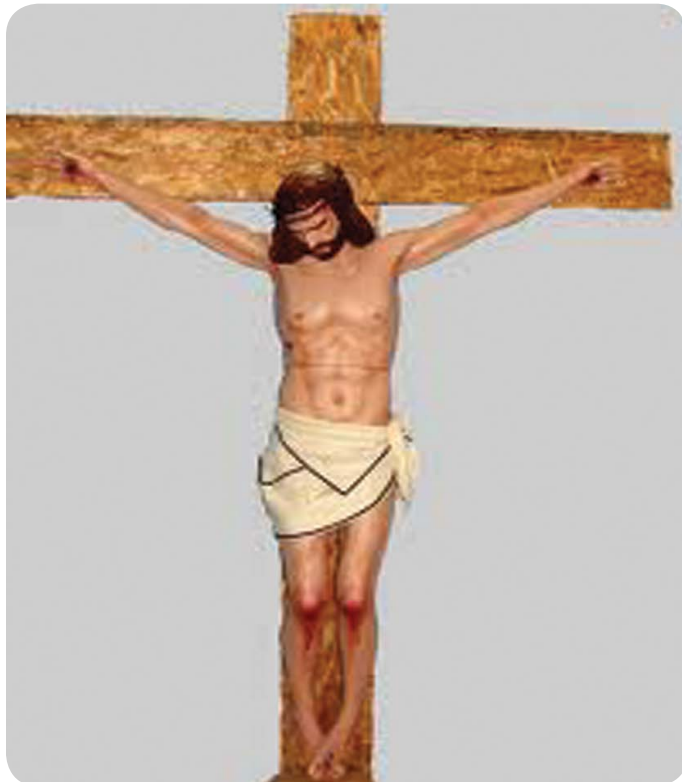
16.2 රූපය - මිනිසා පාපයෙන් ගලවා ගැනීමට ජේසුස් වහන්සේ යාග වීම