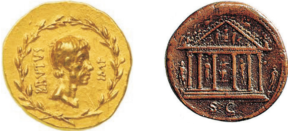
පැරණි රෝම කාසි හා තඹ කාසි

කාසි දෙවර්ගයක් යොදා ගෙන බදු වර්ග දෙකක් ගෙවීමට එකල ජුදෙව් ජනතාවට සිදු ව තිබිණි. මෙහි දී රෝම රජයට බදු ගෙවීමට සිසර්ගේ රූපය මුද්‍රිත ව තිබූ රිදියෙන් නිම වූ ‘දිනාර්’ කාසි භාවිත කළ යුතු විය. එහෙත් දේව මාලිගාවේ බද්ද ගෙවීමේ දී තඹ කාසි භාවිත කරන්නට සිදු විය. හේතුව යමෙකුගේ රූපය මුද්‍රිත කාසිවලින් එම බද්ද ගෙවීම ව්‍යවස්ථාවෙන් තහනම් වූ නිසාය.