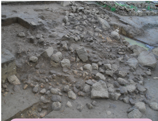
උඩරංවාමඩම නිවසෙහි අත්තිවාරම

නිවසේ පිටුපස කොටස භාවිත කර තිබෙන්නේ මුළුතැන්ගෙයක් ලෙස ය. කැණීම්වල දී ඊට අයත් ළිප සොයා ගැනීමට පුරාවිද්‍යාඥයෝ සමත් වූහ. ළිප අවට තිබී යකඩ පිහි කැබලි කිහිපයක් සහ ගල්මෙවලම් කිහිපයක් හමු විය. මුළුතැන්ගෙයින් පිටතට ජලය ගලා යෑමට කානුවක් සකස් කර තිබිණි. මෙම නිවාසය තුළ තිබී රතු පැහැයෙන් වර්ණ ගැන්වූ ඉතාමත් විසිතුරු කුඩා මැටි බඳුනක් ද සොයා ගැනිණි. බිම් සැලැස්ම පරීක්ෂා කරන විට ඉතා පැහැදිලි ව පෙනෙන්නේ මෙම නිවෙස ඉදි කර තිබෙන්නේ ඉදිරිපස කොටස දකුණු දිශාවටත් පිටුපස කොටස උතුරු දිශාවටත් වන පරිද්දෙන් බව යි.