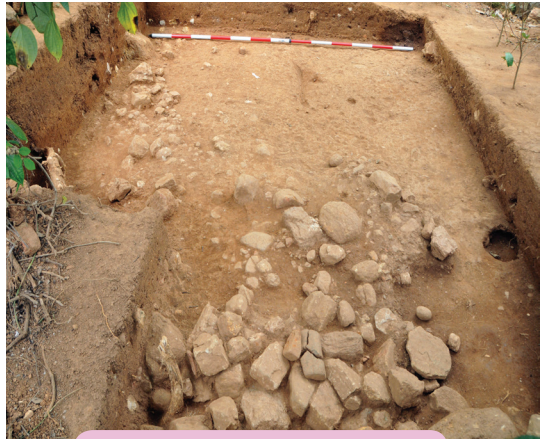
හල්දුම්මුල්ලේ නිවසෙහි අත්තිවාරම.

නිවාස තැනීම පිළිබඳ දීර්ඝ ඉතිහාසයක් ශ්‍රී ලංකාව සතූ ය. එම ඉතිහාසය පිළිබිඹු කරන සාක්ෂි සොයා ගෙන තිබෙන්නේ පුරාවිද්‍යාත්මක කැණීම් මඟිනි. දැනට අනාවරණය වී ඇති තොරතුරුවලට අනුව ක්‍රිස්තු පූර්ව 1750 වන විට ශ්‍රී ලංකාවේ කඳුකර පළාත්වල ජීවත් වූ ජනතාව නිවාස තනා ගැනීමේ සමත්කම් දැක්වූ බව තහවුරු වී තිබේ. ඒ කාලයට අයත් පැරණි නිවාසයක ගෙබිමක් සොයා ගැනීමට 2011 වසරේ දී පුරාවිද්‍යාඥයෝ සමත් වූහ. එය පිහිටා තිබෙන්නේ බදුල්ල දිස්ත්‍රික්කයට අයත් හල්දුම්මුල්ලේ පිහිටි ‘කොස්වත්ත’ නමින් හැඳින්වෙන පෞද්ගලික තේ වත්තක ය.