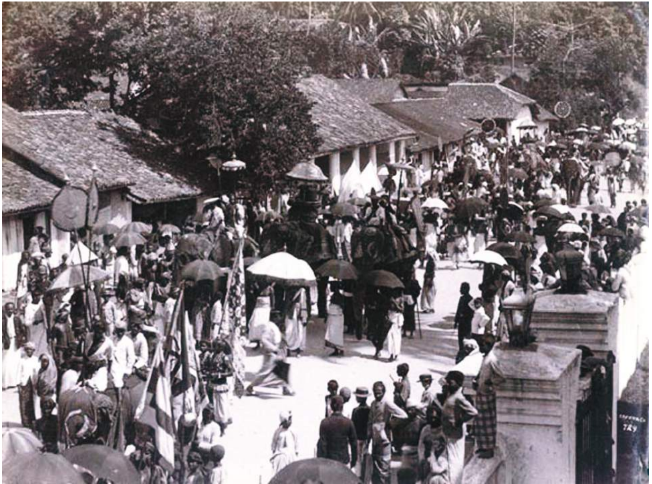
ඡායාරූපය අංක 8.2 දහනමවන සියවසේ දී මහනුවර දළදා පෙරහැර සහ මහනුවර නගරයේ විදිවල ස්වරූපය පෙන්වන දුර්ලභ ගනයේ ඡායාරූපයකි

ලන්දේසීන් සමඟ සාමකාමීව කටයුතු කිරීමට ක්‍රියා කළේය. දක්ෂ පාලකයෙකු නොවූව ද සිය පියාගේ සමයේ මහනුවර රාජධානියේ බලය ව්‍යාප්තව තිබූ ප්‍රදේශය රැක ගැනීමට මෙතුමා සමත් විය.