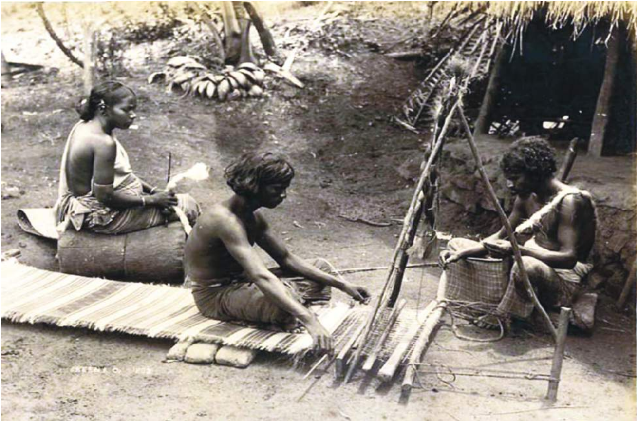
ඡායාරූපය අංක 8.3 මහනුවර යුගයේ පැවති පැදුරු විවීමේ කර්මාන්තය ඉදිරියට ගෙන ගිය දහනමවන සියවස අයත් ශිල්පීන් පවුලක්