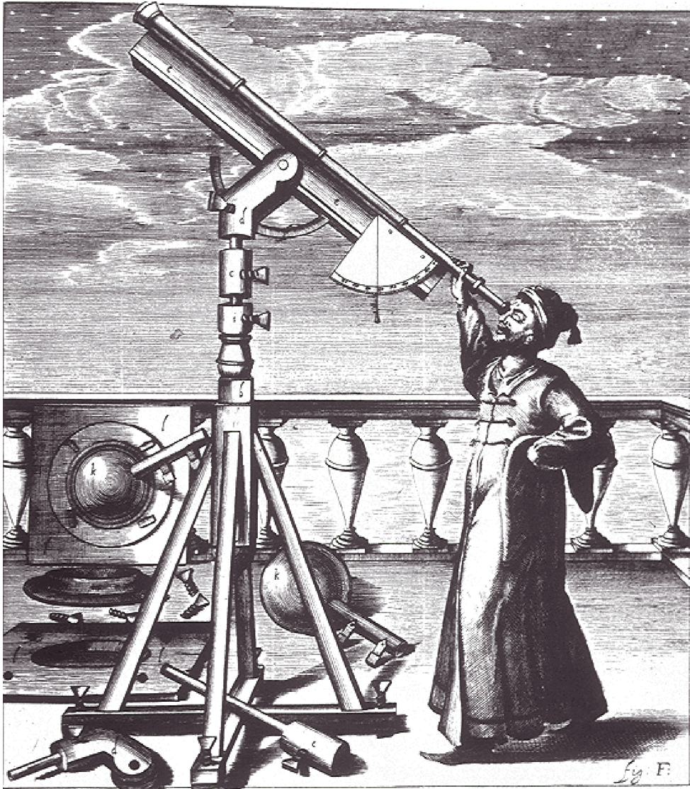
ජායාරූපය අංක 9.2 ගැලිලියෝ ගැලිලි දුරේක්ෂයෙන් අභ්‍යවකාශය පරීක්ෂා කරන අන්දම දක්වන සිතුවමකි. විද්‍යාත්මක සොයා ගැනීම් යුරෝපීය පුනරුද යුගයේ කැපී පෙනෙන ප්‍රවණතාවකි.

ග්‍රීක ලතින් භාෂාවන් ඉගෙන ගැනීමෙන් පසු එම භාෂාවෙන් ලියවුණ පොත්පත් හැදෑරීම නිසා සාහිත්‍යයේ නව ප්‍රබෝධයක් සිදු විය. විශේෂයෙන් ග්‍රීක නාට්‍ය පිළිබඳ බලවත් උනන්දුවක් ඇති විය. සාහිත්‍යමය වශයෙන් සේවයක් කළ ගත් කතුවරු රැසක් මෙකල බිහි වූහ. ඉතාලියේ ඩාන්ටේ, පෙට්රාක්, බොකැෂියෝ, එංගලන්තයේ සර් තෝමස් මුවර්, ප්‍රැන්සිස් බෙකන් හා විලියම් ෂෙක්ස්පියර් ප්‍රංශයේ ඉරාස්මස් ද මේ අතර වැදගත් තැනක් ගනී. ඔවුහු කෘති රැසක් රචනා කළහ. නිදසුන් ලෙස ඇලගියර් ඩාන්ටේ රචනා කළ ඩිවිනා කොමීඩියා කාව්‍ය ග්‍රන්ථය ද පෙට්රාක් රචනා කළ ලෝරාට් සැහැලි කවි නම් ග්‍රන්ථය ද පෙන්නුම් කළ හැකි ය.