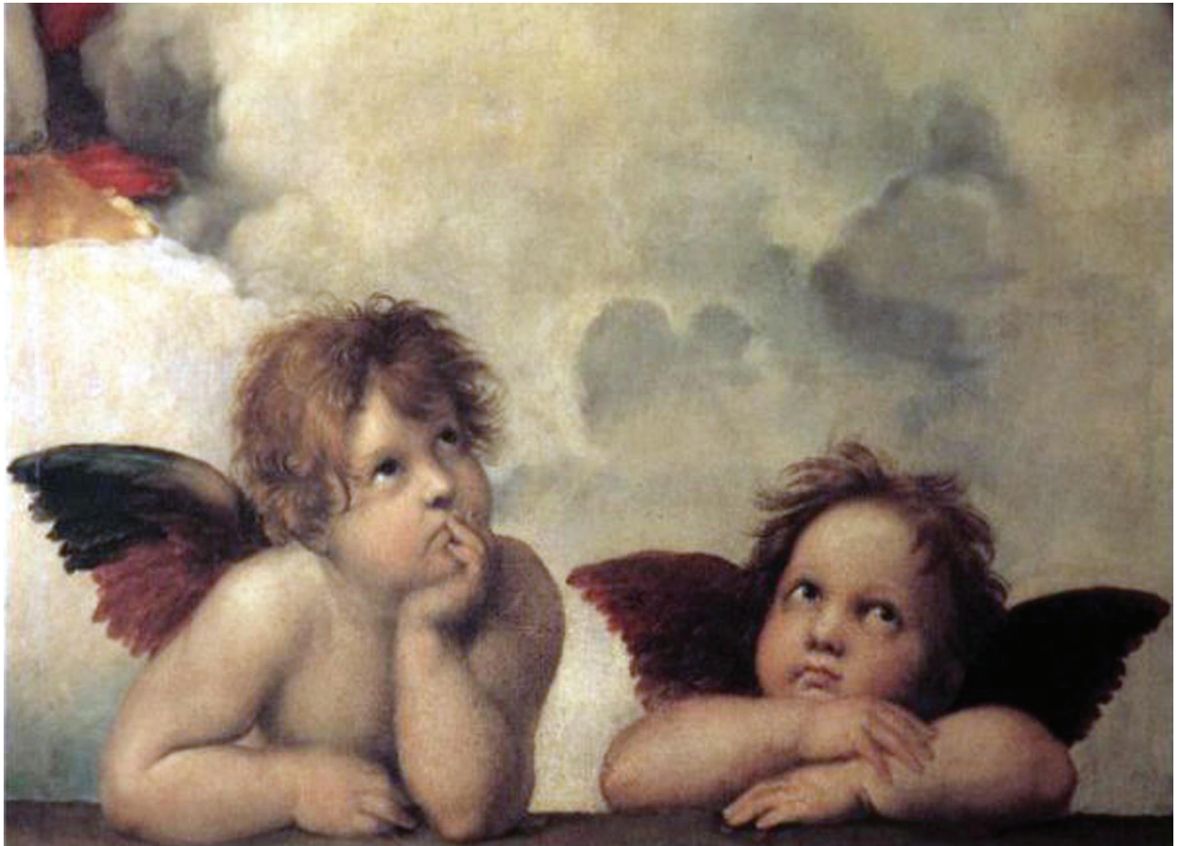
ඡායාරූපය අංක 9.1 මයිකල් ආන්ජිලෝ විසින් සිස්ටයින් දෙව්මැදුරේ සිතුවම් කර තිබෙන දේව දරුවන් දෙදෙනෙකු දැක්වෙන චිත්‍රයක්

තවත් හේතුවක් වූයේ මුද්‍රණ කර්මාන්තය යි. වර්ෂ 1454 දී ගුටන්බර්ග් මුද්‍රණ යන්ත්‍රය නිපදවීමත් සමඟ ඉතාලියේ ප්‍රදේශ රැසක මුද්‍රණාල ආරම්භ විය. මේ යටතේ පොත් පත් සුලබ වීමත් ශ්‍රීක රෝම පොත් පත් මුද්‍රණයෙන් නිකුත් වීමත් නිසා එම සාහිත්‍ය, නාට්‍ය කලාව ආදිය කෙරෙහි ප්‍රබල උනන්දුවක් ඇති වීමට හේතු විය.