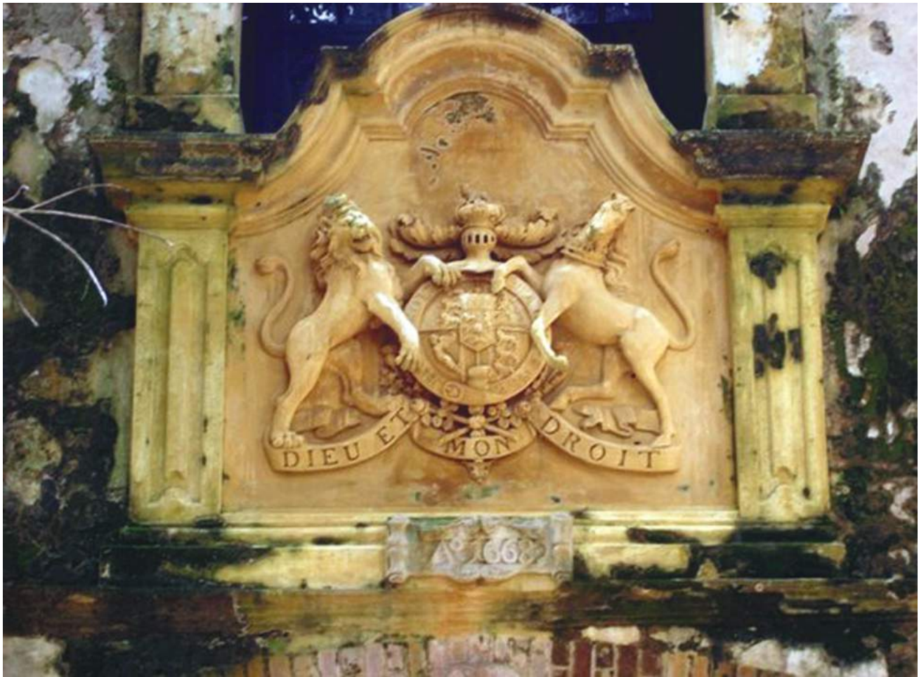
ජායාරූපය අංක 10.1 පැරණි ගොඩනැගිල්ලක කැටයම් කර තිබෙන ලන්දේසින්ගේ ලාංඡනය.

පෘතුගාලයෙහි නාවුක විද්‍යාලයක් පවත්වාගෙන ගිය හෙතෙම නාවික ශිල්පය, සිතියම් විද්‍යාව, තාරකා ශාස්ත්‍රය වැනි විෂයන් එහි ඉගැන්වීය. මෙම කරුණු නිසා ආසියාවට නව මුහුදු මාර්ගයක් සෙවීමේ කටයුතුවල දී සෙසු යුරෝපීයයන්ට වඩා පෘතුගීසිහු ඉදිරියෙන් සිටියහ. පෘතුගීසි ජාතිකයෙකු වූ වස්කෝද ගාමා අප්‍රිකාව වටා ගමන් කොට වර්ෂ 1498 දී ඉන්දියාවේ කැලිකට්ටුවලට පැමිණීමත් සමඟ ආසියාවේ යුරෝපා බල ව්‍යාප්තිය ආරම්භ විය. පෘතුගීසින් ආසියාවට පැමිණීමෙන් පසුව ලන්දේසි, ඉංග්‍රීසි, ප්‍රංශ වැනි සෙසු යුරෝපීයයෝ ද ආසියාවට පැමිණ විවිධ ප්‍රදේශවල තම බලය පැතිර වූහ. මෙසේ 16 වන සියවස ආරම්භයේ සිට වසර 450 ක් පමණ ආසියාවේ යුරෝපා බල ව්‍යාප්තිය පැවතුණි.