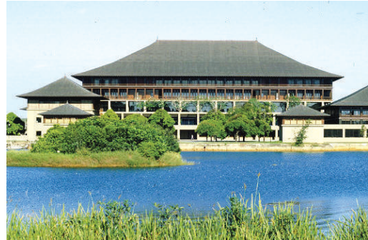
1.5 රූපය - ශ්‍රී ලංකා පාර්ලිමේන්තුව