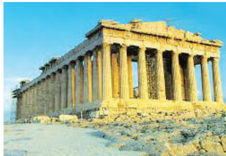
1.2 රූපය - පාර්නිතන් ඇක්‍රෝපොලිස් ඇතැන්ස් - ග්‍රීසිය

ග්‍රීසියේ “ඇතැන්ස්” පෞර රාජ්‍යයේ පාලන කටයුතු සෘජු ප්‍රජාතන්ත්‍රවාදී ලක්ෂණ පදනම් කර ගෙන සිදු වූ බව සඳහන් වේ. ඇතැන්ස් පෞර රාජ්‍යයේ ප්‍රධාන පාලන ආයතනයක් වූයේ පුරවැසි සභාවයි. පුරවැසි සභාවේ දී පාලන කටයුතු සම්බන්ධයෙන් පුරවැසියන්ගේ කැමැත්ත සෘජු ව ම විමසීමට ලක් කර ඇත. ඒ අනුව පාලනයට සහභාගි වීමට පුරවැසියන් සියලු දෙනාට ම අවස්ථාව ලැබී ඇත. එහෙත් නගර වැසි කාන්තාවන්ට, වහලුන්ට හා විදේශිකයන්ට එයට සහභාගි වීමට අවස්ථාව ලැබී නැත. ඇතැන්ස් නගරයේ පැවති මෙම පාලන ක්‍රමය සෘජු ප්‍රජාතන්ත්‍රවාදී පාලන ක්‍රමය ලෙස හැඳින්වේ. තීන්දු ගැනීමේ ක්‍රියාවලියට සියලු දෙනා ම සම්බන්ධ වීම සෘජු ප්‍රජාතන්ත්‍රවාදය ලෙස අර්ථ දැක්විය හැකි ය.