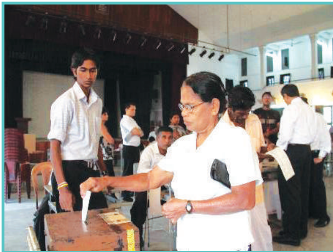
1.3 රූපය - ඡන්දය ප්‍රකාශ කරන අවස්ථාවක් දක්වන ඡායාරූපයක්

“ශ්‍රී ලංකා ජනරජයේ පරමාධිපත්‍යය ජනතාව කෙරෙහි පිහිටා ඇත්තේ ය. පරමාධිපත්‍යය අත්හළ නොහැක්කේ ය. පරමාධිපත්‍යයට පාලන බලතල, මූලික අයිතිවාසිකම් සහ ඡන්ද බලය ද ඇතුළත් වන්නේ ය.”