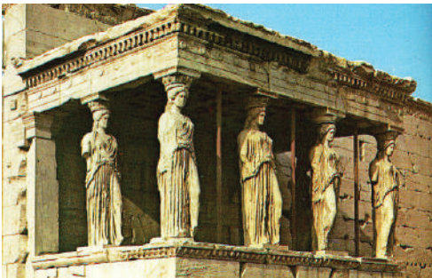
1.1 රූපය - කාරියට්ඩිස් අංගනය - ඇතැන්ස් ග්‍රීසිය

ප්‍රජාතන්ත්‍රවාදී පාලන ක්‍රමයේ ඇතැම් ලක්ෂණ ඇත අතීතයේ පටන් පෙරදිග හා අපරදිග රටවල ක්‍රියාත්මක වූ බවට සාක්ෂ්‍ය ඉතිහාසයෙන් හමු වේ.