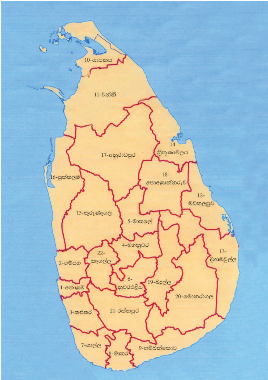
1.4 රූපය - ශ්‍රී ලංකාවේ මැතිවරණ දිස්ත්‍රික්ක සිතියම

නිදසුනක් ලෙස ශ්‍රී ලංකාවේ මැතිවරණ දිස්ත්‍රික්ක සිතියම මෙහි දක්වා ඇත.