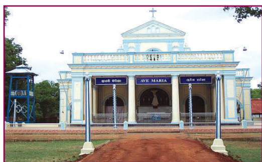
3.1 රූපය - ශ්‍රී ලංකාවේ ආගමික ස්ථාන කිහිපයක්